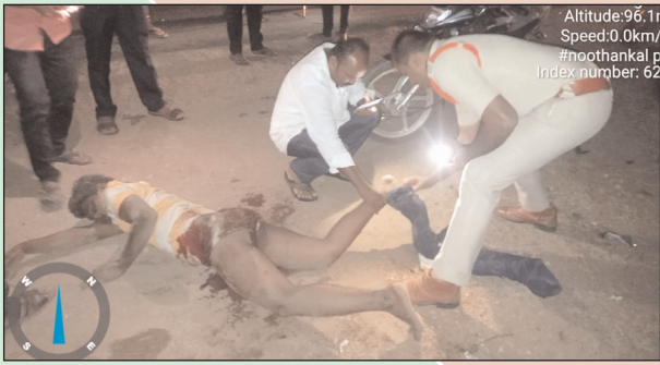
Altitude:96.11 Speed:0.0km/h #noothankal p Index number: 62