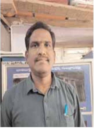
మంది మిత్రులను జత చేసి బిలుకూరు బాలాజీ దేవాలయం ప్రాంగణంలో