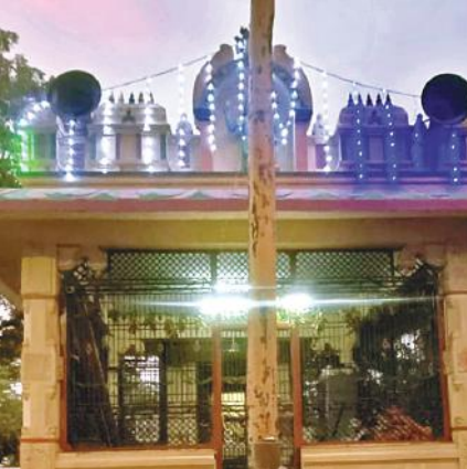
లక్ష్మీ చెన్నకేశవ స్వామి దేవస్థానం