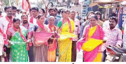
మున్సిపల్ కార్మికులు భిక్షాటన చేస్తున్న దృశ్యం

పోగా ప్రభుత్వం రెచ్చగొట్టే చర్యలకు పాల్పడటం శోచనీయమని, అరెస్టులు, బెదిరింపులు, నిర్బంధాలతో కార్మికుల సమ్మె పోరాటం ఆగదని, ముఖ్యమంత్రి మున్సిపల్ కార్మికులకు ఇచ్చిన మాట తప్పారని, సమ్మె వలన ప్రజలకు కలిగే అసౌకర్యానికి ప్రభుత్వమే బాధ్యత వహించాలని, ఒకవైపు కరోనా విస్తరిస్తోందని, ప్రజారోగ్యం క్షీణిస్తోందని, పట్టణాలు మురికి కంపు కొడుతూ డ్రైనేజీలు పొంగి పొరుతున్నా ప్రభుత్వానికి చలనం లేదని, కార్మికులపై నెపం నెట్టి తప్పుకోవాలని ముఖ్యమంత్రి చూస్తున్నారని, కార్మికుల సమ్మెకు ప్రభుత్వమే బాధ్యత వహించాలని, సమ్మెను సకాలంలో పరిష్కరించి ప్రజా రోగ్యాన్ని కాపాడాలని, ప్రభుత్వం నిరక్షమ ప్రదర్శిస్తే ఆందోళన విస్తృతం అవుతుందని, వామపక్షాలు, రాజకీయ పార్టీలు, కార్మిక సంఘాలు, ప్రజా సంఘాలు రంగంలో