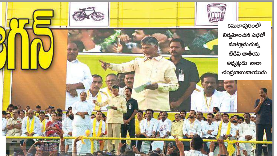
కమలాపురంలో నిర్వహించిన సభలో మాట్లాడుతున్న టిడిపి జాతీయ అధ్యక్షుడు నారా చంద్రబాబునాయుడు