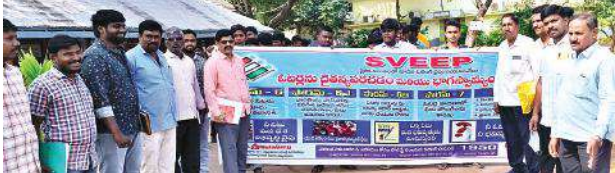
ఓటు హక్కు పై అవగాహన ర్యాలీ నిర్వహిస్తున్న దృశ్యం