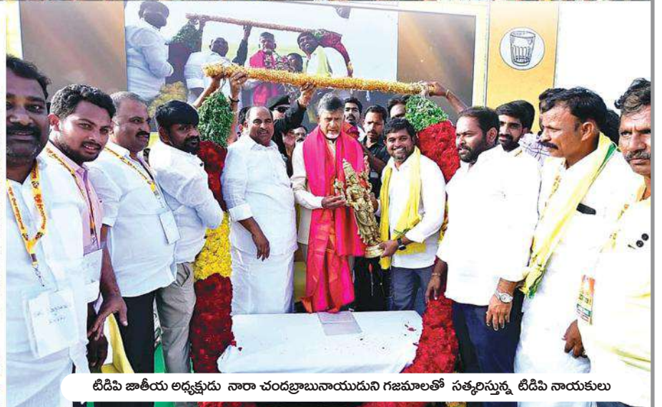
టిడిపి జాతీయ అధ్యక్షుడు నారా చంద్రబాబునాయుడుని గజమాలతో సత్కరిస్తున్న టిడిపి నాయకులు