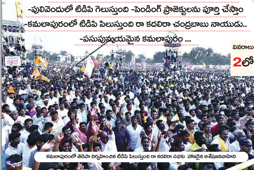
కమలాపురంలో తెదెపా నిర్వహించిన టిడిపి పిలుస్తుంది రా కదలిరా సభకు హాజరైన అశేషజనవాహిని