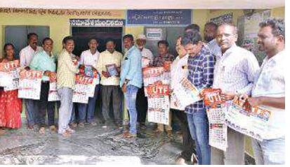
క్యాలండర్ ఆవిష్కరిస్తున్న ఎంఈఓలు, ఉపాధ్యాయులు

సంవత్సరంవిద్యార్థుల నమోదు పెంచాలని తెలిపారు. మండలంలోని ఉపాధ్యాయులు మండల విద్యాభివృద్ధికి కృషి చేయాలని సూచించారు. ఈకార్యక్ర మంలో మండ లంలోని ఉన్నత పాఠశాల ప్రధానో పాధ్యాయులు యూటిఎఫ్ మండల కమిటీ సభ్యులు ఉపాధ్యాయులు పాల్గొన్నారు.