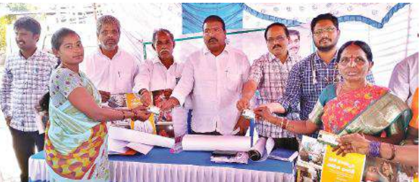
హెల్త్ కార్డులు పంపిణీ చేస్తున్న అధికారులు