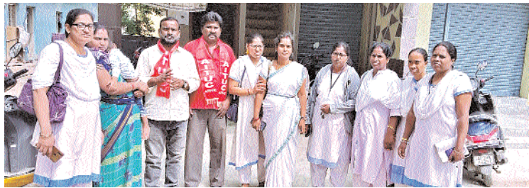
ఇవ్వాలని డిమాండ్ చేశారు. కొన్ని ప్రాథమిక ఆరోగ్య కేంద్రాలలో ఆశా కార్యకర్తలను తోటి సిబ్బంది ఆశాలను చులకణభావంతో చూడటం మానుకోవాలని కోరారు. ఆశా కార్యకర్తల సమస్యలు పరిష్కరించకపోతే 2024 లో ఆందోళనలు ఉద్యమం చేస్తామన్నారు.