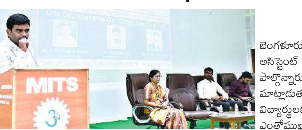
- మిట్స్ కళాశాలలో అవగాహన కార్యక్రమం

కురబలకోట, మేజర్ న్యూస్ : మదనపల్లె పట్టణం సమీపంలో గల మదనపల్లె ఇన్స్టిట్యూట్ ఆఫ్ టెక్నాలజీ అండ్ సైన్స్ (మిట్స్ కళాశాల) నందు డిపార్ట్మెంట్ ఆఫ్ మేనేజ్మెంట్ స్టడీస్ వారు కెరీర్ ఆపెర్చునిటీస్ ఇన్ మేనేజ్మెంట్ అనే అంశంపై శనివారం అవగాహన కార్యక్రమాన్ని ఏర్పాటు చేశారు. ఈ కార్యక్రమానికి రిసోర్సు పర్సన్ గా