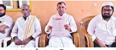
తయారుచేసిన గ్రూప్స్ ప్రశ్న పత్రాన్ని చూపిస్తున్న దృశ్యం

సమావేశంలో మాట్లాడుతూ పేసీ బుక్, ఇంస్టాగ్రామ్, ట్విట్టర్ వేదికగా ప్రతి రోజు కొత్త తరహా ప్రశ్నలతో విద్యార్థి అరచేతిలో గ్రూప్స్ మెటీరియల్ నేటి నుండి పరీక్షలు పూర్తి అయ్యే వరకు ప్రతిరోజు యాభై సమాధానాలతో కూడిన ప్రశ్నోత్తరాలను అపార అనుభవం కలిగిన నిష్ణాతులైన వారిచే తయారుచేసి మెటీరియల్ కౌన్సిల్ నుండి విద్యార్థులకు అందజేస్తామని చెప్పారు. నావంతు ఓ ప్రయత్నంగా నిరుద్యోగ యువతీ, యువకులతో పాటు