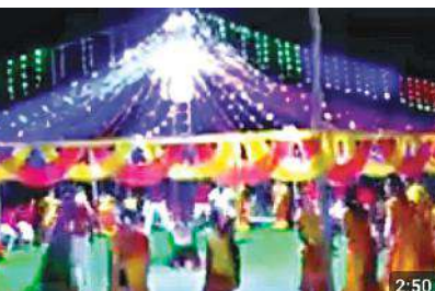
కోలాటం వేసేందుకు విద్యుత్ దీపాలతో అలంకరించిన దృశ్యం ( ఫైల్ ఫోటో )

జేస్తూ ప్రజలను మేల్కొనపడడమే, ఈ కోలాటం యొక్క సారాంశం అని తెలిపారు. ఇలా గత మూడు నెలల నుంచి శ్రీ శ్రీ రామ మహిళా కోలాటం బృందం, శ్రీ వెంకటేశ్వర మహిళా కోలాటం బృందం పెద్ద ఎత్తున మహిళలు నేర్చుకున్నారు. కోలాటం నేర్చుకోవడం పూర్తయిన సందర్భంగా ఈనెల 12వ తేదీ శ్రీశ్రీరామకోలాటం మహిళా బృందం వారు, అలాగే 14వ తేదీ శ్రీ వెంకటేశ్వర మహిళా కోలాటం బృందం వారు గజ పూజ కార్యక్రమం నిర్వహిస్తున్నట్లు గురువులు, గ్రామ కమిటీ సభ్యులు తెలిపారు. 12వ తేదీ సాయంత్రం 5:30 నిమిషాల నుంచి కోలాటం గజ పూజ కార్యక్రమం జరుగు రని