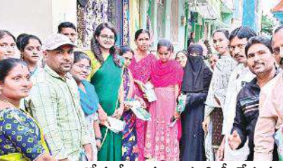
ఆరోగ్యశ్రీ కార్డులు పంపిణీ చేస్తున్న అధికారులు, ప్రజాప్రతినిధులు

వ్యవసాయ భూములను అధికారంలో ఉండే పెద్దలు కబ్జా చేయడానికి ఉపయోగ పడుతుందని వారు తీవ్రంగా విమర్శించారు. ప్రజాస్వామ్య వ్యవస్థలో న్యాయస్థానాలు కీలకంగా ఉన్నాయి, అలాంటి న్యాయస్థానాలను పక్కనపెట్టి ల్యాండ్ ట్రైబిల్ కి ఒక రెవెన్యూ అధికారిని జిల్లా స్థాయిలో నియమిస్తే సామాన్య ప్రజలకు వారి ఆస్తులకు భద్రత లేకుండా పోతుందని విమర్శించారు. అంతే కాకుండా రాష్ట్రవ్యాప్తంగా 553 కోర్టులు ఉన్నాయని 553 కోట్లలో పరిష్కారం కానీ భూ వివాదాలు కేవలం 26 జిల్లాలలో 26 మంది అధికారులను అధికారులను పెడితే ఎలా పరిష్కారమవుతారని కేవలం భూ హక్కు చట్టం వల్ల ప్రజలను రెవెన్యూ అధికారులు వారి కార్యాలయం చుట్టూ తిప్పుకోవడం తప్ప మరి ఏమీ చేయలేరని విమర్శించారు.