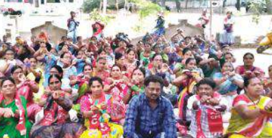
అంగన్వాడీల చేతులకు సంకెళ్లతో నిరసన వ్యక్తం చేస్తున్న దృశ్యం