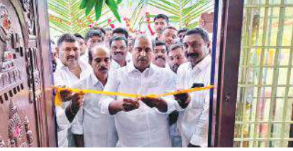
టీడిపి కార్యాలయం ప్రారంభిస్తున్న పుత్త..

ప్రారంభమైంది అన్నారు. ఈసారి ఎన్నికల్లో భారీ మెజార్టీ సాధిస్తామన్నారు, 30 నుంచి 40 వేలు మెజార్టీ వచ్చే అవకాశాలు ఉన్నాయన్నారు. వైసీపీ పాలనలో వినుగు చెందిన ప్రజలు తెలుగుదేశం పార్టీ వైపు అదర అభిమానాలు ఎక్కువగా కనిపిస్తున్నాయన్నారు. నియోజకవర్గంలో ఇప్పటికే 60 గ్రామపంచాయతీలో టీడిపి పార్టీలో చేరారు అన్నారు. ఒక వీరపునాయిని వల్లె మండలంలోని 21 గ్రామ పంచాయతీలకు గాను 17 పంచాయతీల్లో చేరిన వారిలో మా పార్టీ బలం ఉందన్నారు, ఇంకా ఆరు మండలాల్లో ఎక్కువగా ప్రజలు పార్టీలో చేరుతారు అన్నారు. గతంలో ఎన్నడు లేని ప్రజా సంక్షేమ పథకాలను చంద్రబాబు నాయుడు తీసుకు వస్తారన్నారు. అన్ని వర్గాలకు మేలు జరుగుతుందన్నారు. తమ పార్టీ గత ప్రభుత్వ హయాంలో ఎవరిని ఇబ్బందులకు గురి చేయలేదన్నారు. ప్రస్తుతం అంగన్ వాడీలు, మున్సిపల్ కార్మికులు తమ న్యాయమైన కోరికలకు సమ్మె చేస్తూ ఉంటే పట్టించుకునే నాధుడే కరువయ్యారన్నారు. పార్టీ అధికారంలోకి వచ్చిన వెంటనే ఉద్యోగుల భవిష్యత్, ప్రజల సంక్షేమం పైనే కృషి చేస్తానన్నారు. ఈ ప్రారంభోత్సవ కార్యక్రమంలో టీడిపి యువ