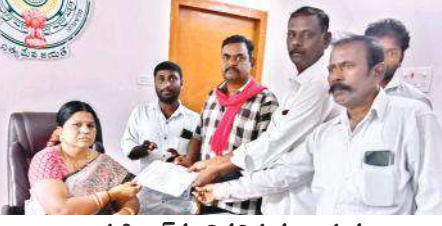
తాహసీల్దార్ కు వినతిపత్రం ఇస్తున్న రైతు సంఘం నాయకులు

నాయకులు స్థానిక రెవెన్యూ అధికారులు కలిసి ఎటువంటి సమస్య లేకపోయినా తను చెప్పిన మాట వినక పోయిన తమకు ఆర్థికంగా సహాయం చేయకపోయినా రైతులపై, ప్రజలపై వేధింపులకు పాల్పడి ఇబ్బందులకు గురి చేస్తారన్నారు. అందుకే అధికార పార్టీ తీసుకొచ్చినటువంటి ఈ చట్టం పైన చట్టం ప్రజలకు, రైతులకు నష్టం చేకూర్చే విధంగా ఉన్న తమ పార్టీ అధికారంలోకి వస్తే తమకు ఉపయోగపడుతుందని చట్టాన్ని ప్రతిపక్షంలో ఉన్న పార్టీలు వ్యతిరేకించడం లేదని కేవలం న్యాయ వాదులు మాత్రమే చట్టం పైన ఉద్యమిస్తున్నారని ఇప్పటినుంచి జిల్లాలో రైతు సేవా సమితి కూడా చట్టానికి వ్యతిరేకంగా ప్రజలకు, రైతులకు చట్టం పైన గ్రామాలలో అవగాహన కల్పించే కార్యక్రమాలు