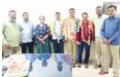
సూర్య జిగిత్యాల ప్రతినిధి:

తెలంగాణ జూనియర్ ఫారెస్ట్ ఆఫీసర్స్ అసోసియేషన్ జిగిత్యాల యూనిట్ నూతన కార్యవర్గం ఆదివారం నాడు ఎన్నికయింది.