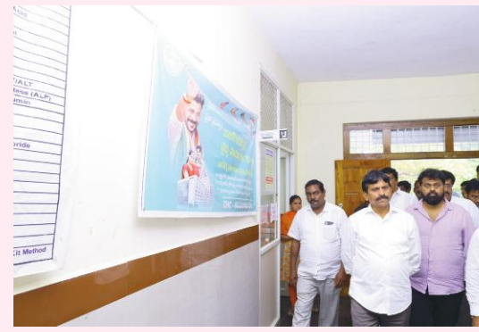
ఆసుపత్రిలో తనిఖీ సమయంలో విధుల్లో లేని వైద్యులు, సిబ్బందిపై అగ్రహం వెలిబుచ్చారు.