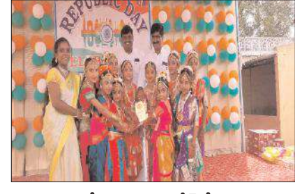
-సరస్వతి గురుకుల ఇంగ్లీష్ మీడియం విద్యాలయంలో