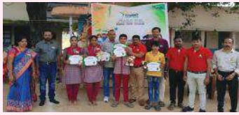
సింగరేణి సూర్య మేజర్ స్కూల్స్