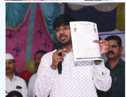
ఖమ్మం