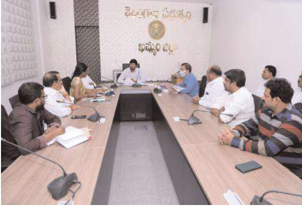
ఖమ్మం, (సూర్య బ్యూరో)

-మిల్లర్ల సమావేశంలో జిల్లా కలెక్టర్ వి పి గౌతమ్