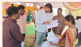
బోనకల్, సూర్య (మేజర్