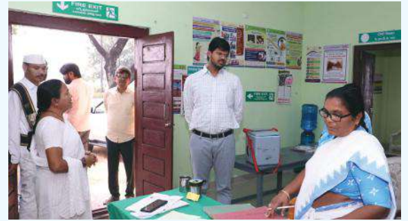
ఖమ్మం, (సూర్య బ్యూరో)

జిల్లా కలెక్టర్ వి.పి. గౌతమ్ బుధవారం పెనుబల్లి మండలం టేకులపల్లి గ్రామంలోని పల్లె దవాఖానా ఆకస్మిక తనిఖీ చేశారు. పల్లె దవాఖానాలో అందుబాటులో ఉన్న మందుల గురించి అడిగి తెలుసుకున్నారు. సిబ్బంది ఎంతమంది ఉన్నది పరిశీలించారు. గ్రామంలో ఎంతమందికి బి.పి., షుగర్ లకు మందులు ఇస్తున్నది, ఇంకనూ ప్రయివేటుగా ఎంతమంది మందులు వాడుతున్నది అడిగారు. బి.పి., షుగర్ లకు మంచి మందులు పూర్తి ఉచితంగా అందజేస్తామని ప్రజల్లో అవగాహన కల్పించాలన్నారు. పల్లె దవాఖానాలో కుక్క, పాము కాటుకు మందులు అందుబాటులో ఉంచినట్లు తెలిపారు. పల్లె దవాఖానాలు ప్రాథమిక ఆరోగ్య కేంద్రాల సదుపాయాలతో ప్రజలకు అందుబాటులో వైద్య సేవలు అందిస్తున్నట్లు, దీనిని సద్వినియోగం చేసుకోవాలని కలెక్టర్ అన్నారు.