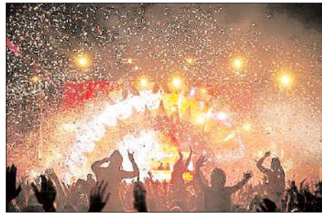
నూతన సంవత్సర వేడుకల మన సంస్కృతికి అద్దం పడతాయి. వార్షిక క్యాలెండర్లు.