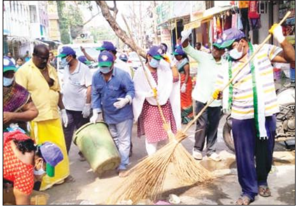
కృష్ణలంక, మేజర్ న్యూస్ : "ఇల్లు కాలి ఒకడు ఏడుస్తుంటే దాంట్లోవంకాయ ఉడికిందా లేదా అని అడిగాడంట ఒకడు" అట్లా ఉంటది ప్రతిపక్ష