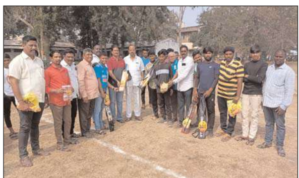
సందర్భంగా దోస్త్ మరియు తెలుగుదేశం పార్టీ

దుగ్గిరాల, మేజర్ న్యూస్ : దుగ్గిరాల బంగా మైదానంలో లోని క్రీడా ప్రాంగణంలో ఆదివారం గ్రామ క్రీడాకారులకు దోస్త్ మరియు తెలుగుదేశం పార్టీ అధ్యక్షులతో క్రీడా పరికరాలను అందజేశారు. ఈ సందర్భంగా క్రీడల్లో మంగళగిరి పట్టణంలో జరుగుతున్న పోటీలలో విజేతలుగా నిలవాలని ఆశిస్తూ క్రీడాకారులకు క్రీడా పరికరాలను పంపిణీ చేశారు. క్రికెట్, వాలీబాల్, షటిల్ కు సంబంధించిన పరికరాలను యువకులకు అందజేశారు. ఈ