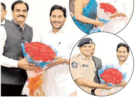
నేటి దినపత్రిక సూర్య, గుంటూరు బ్యూరో