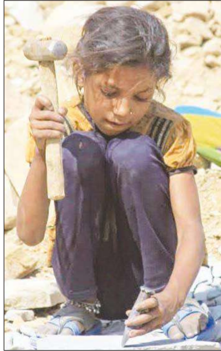
ఫలితం దక్కలేదు. బాలకార్మికుల సమస్యను ఎదుర్కోవడానికి ప్రభుత్వం పలు చర్యలు చేపడుతున్నా పేదరికం, నిరక్షరాస్యత వంటి కారణాల వల్ల పురోగతి కొరవడుతోంది.

బాలకార్మిక వ్యవస్థ నిర్మూలనకు ఉన్న అవకాశాలను గుర్తించేందుకు 1979లో గురుపాదస్వామి కమిటీని కేంద్రం నియమించింది. ఆ కమిటీ సిఫార్సుల ఆధారంగా 1986లో బాలకార్మిక వ్యవస్థ నిషేధ, నియంత్రణ చట్టం తెచ్చారు. ప్రమాదకర వృత్తుల్లో పనిచేస్తున్నవారి పునరావాసంపై దృష్టి సారించేందుకు 1987లో జాతీయ విధానాన్ని రూపొందించారు. 1988 నుంచి కార్మిక, ఉపాధి కల్పనా మంత్రిత్వ శాఖ బాలకార్మికుల పునరావాసానికి పెద్ద సంఖ్యలో పథకాలను అమలు చేసింది. పలు స్వచ్ఛంద సంస్థలు బాలల విద్య, ఇతర వసతుల కల్పనకు కృషిచేసినా