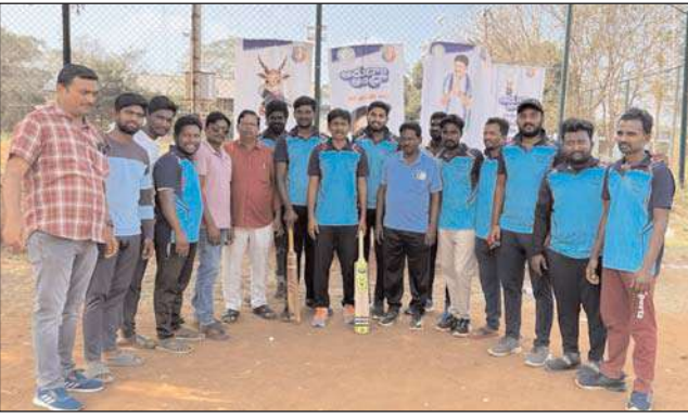
బ్యాటింగ్ కు దిగిన పెదకాకాని జట్టు 40 పరుగులకు కుప్పకాలడం గమనార్హం. ఫైనల్

పెదకాకాని మేజర్ న్యూస్ : ఆంధ్రప్రదేశ్ రాష్ట్ర ప్రభుత్వం ప్రతిష్టాత్మకంగా నిర్వహిస్తున్న ఆడదాం ఆంధ్ర క్రీడా పోటీలలో నంబూరు సచివాలయం-3 వ జట్టు క్రికెట్ విభాగంలో విజయకేతనం ఎగరవేసింది. ఆదివారం ఆచార్య నాగార్జున విశ్వవిద్యాలయంలో జరిగిన క్రికెట్ ఫైనల్ మ్యాచ్లో పెదకాకాని జట్టుపై నంబూరు జట్టు గెలుపొందడం జరిగింది. మొదట టాస్ గెలిచి ఫీల్డింగ్ ఎంచుకున్న పెదకాకాని జట్టు పై నంబూరు జట్టు నిర్ణీత 10 ఓవర్లలో 64 పరుగులు చేసింది. 65 పరుగుల