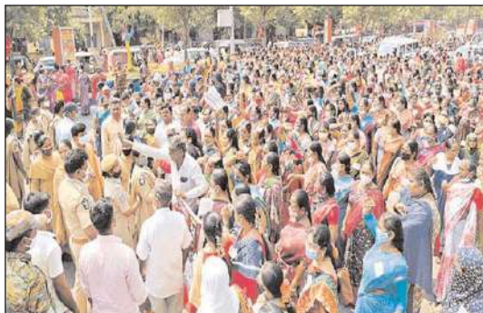
అంగన్వాడీ కార్యకర్తలు, హెల్పర్లు సమ్మె చేస్తున్నారు. రాష్ట్ర వ్యాప్తంగా 1,04,000 మందికి ప్రభుత్వం నోటీసులు జారీ చేయగా.. వారిలో 20 శాతం మంది కార్యకర్తలు, హెల్పర్లు విధుల్లో చేరారు. మిగతా వారిపై చర్యలు తీసుకోవాలని రాష్ట్ర ప్రభుత్వ ఆదేశాల మేరకు కలెక్టర్లు టెర్మినేషన్ ఆర్డర్లు సిద్ధం చేశారు. వీటికి సంబంధించి గెజిట్ నోటిఫికేషన్ జారీ చేయాలని నిర్ణయం తీసుకున్నట్లు సమాచారం. సిబ్బంది తొలగింపుతో కొత్తవారి భర్తీకి ఈ నెల 25న

గుంటూరు జిల్లా నేటి దినపత్రిక సూర్య బ్యూరో : తమ సమస్యలు పరిష్కరించాలంటూ గత 42 రోజులుగా సమ్మె చేస్తోన్న అంగన్వాడీలు, హెల్పర్లపై ఏపీ ప్రభుత్వం చర్యలకు ఉపక్రమించింది. సోమవారం ఉదయం 9.30 గంటలలోపు విధుల్లో చేరని వారిని తొలగించాలని ప్రభుత్వం నిర్ణయం తీసుకుంది. ఈ మేరకు గుంటూరు జిల్లాలో విధులకు హాజరుకాని 1,734 మంది, పల్నాడు జిల్లాలో 1,358 మందిని తొలగిస్తూ ఆయా జిల్లాల కలెక్టర్లు టెర్మినేషన్ ఆర్డర్లను జారీ చేశారు. రాష్ట్ర వ్యాప్తంగా దాదాపు 80వేల మందికిపైగా సిబ్బందిని తొలగిస్తూ టెర్మినేషన్ ఆర్డర్లను సిద్ధం చేసినట్లు తెలుస్తోంది. డిసెంబర్ 12వ తేదీ నుంచి