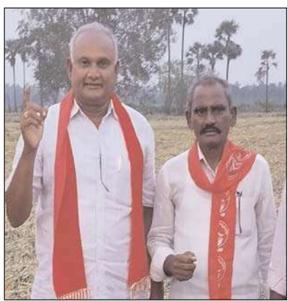
పొన్నూరు మేజర్ న్యూస్ : తెలంగాణ భారత