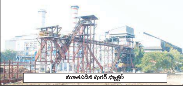
మూతపడిన షుగర్ ప్యాక్టరీ