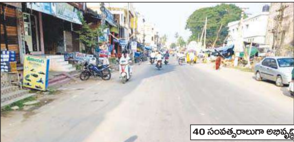
40 సంవత్సరాలూగా లభిస్తున్న చెందని అవనిగడ్డ ప్రధాన రహదారి