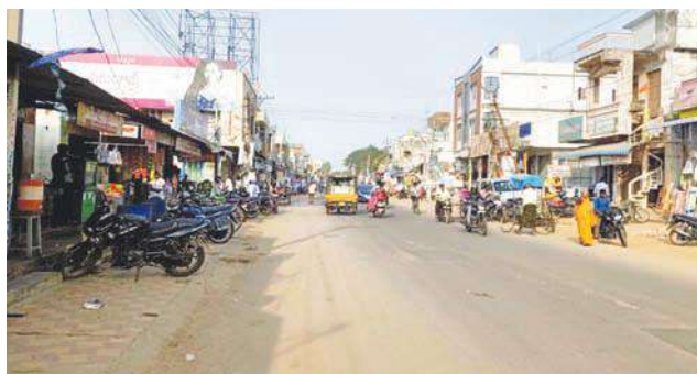
40 సంవత్సరాలుగా అభివృద్ధి చెందని అవనిగడ్డ ప్రధాన రహదారి