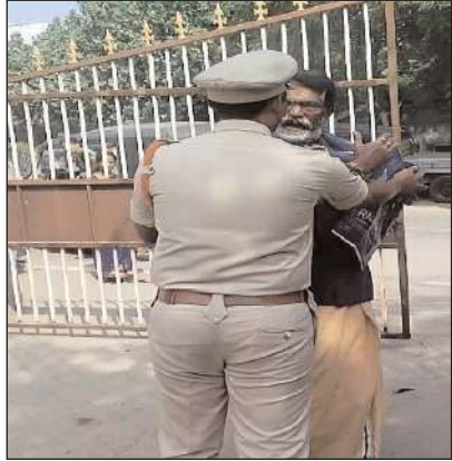
నందిగామ, జనవరి 3, మేజర్ న్యూస్: కలెక్టరేట్ ముట్టడి కి వెళ్తున్న అంగన్వాడీ వర్కర్స్ ను