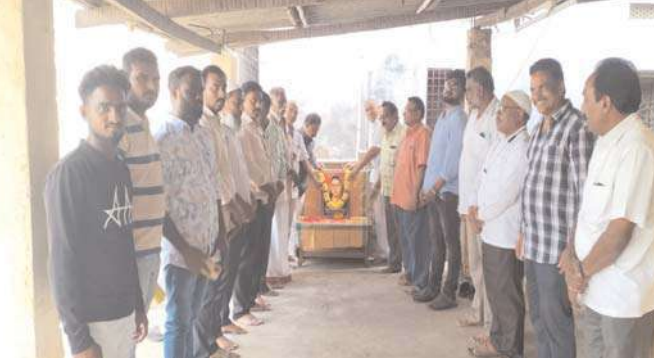
పోస్టూరు మేజర్ న్యూస్ : గొప్ప సంఘసంస్కర్త, ఉపాధ్యాయుని, రచయిత్రి, పాల్గొనడం జరిగింది.