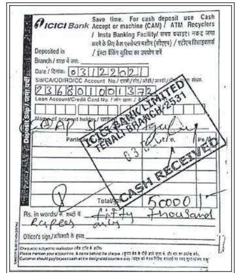
గుంటూరులో రూ.50వేలు జరిమానా విధించిన మత్స్యశాఖ

గతంలో కృష్ణా, గుంటూరు జిల్లాల్లోని చేపల చెరువుల యజమానులకు కోడి వ్యర్థాలతో చేపల పెంపకం అంతగా తెలియదు. పంగన్ చేపల పెంపకం పేరుతో పశ్చిమ గోదావరి జిల్లా నుండి వచ్చిన కొందరు ఈ జాడ్యాన్ని అలవాటు చేసినట్లు చెబుతున్నారు. ఈ చేపల మాఫియాకు