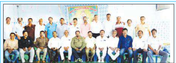
ఉత్సాహంగా పూర్వవిద్యార్థుల సమావేశం

అమ్మకాల్లో 2023లో 28% వృద్ధిని సాధించాం. ఈ క్రమంలోనే 2024-25లో 30%కి పైగా విస్తరించాలని భావిస్తున్నాం. మా మార్కెట్ సు మార్చి 2024 నాటికి రాజమండ్రి, నెల్లూరు,తిరుపతి వంటి అభివృద్ధి చెందుతున్న ప్రాంతాలకు విస్తరించాలని లక్ష్యంగా పనిచేస్తున్నాం. ఆ తరువాత వైజాగ్, విజయవాడ, నెల్లూరు వంటి సంభావ్య ప్రాంతాలపై దృష్టిపెట్టుతున్నాం. “ అని అన్నారు. ప్రస్తుత వినియోగదారుల కొనుగోలు నిర్ణయాలలో ఆరోగ్యానికి ప్రాధాన్యం ఉంది. దీన్ని దృష్టిలో ఉంచుకుని, మ్యూగ్నిఫైక్స్ ఇండియా ఎరో ట్రై ఎలక్ట్రిక్ టెడ్ సు ప్రారంభించింది. ఇది హ్యూండ్ హెల్త్ రిమోట్ ద్వారా నియం త్రించబడి విలాసవంతమైన, ఫంక్షనల్ ఉత్పాదన. ఈ పరుపులో శరీర మృదుతుకు తగ్గట్టు ఎరోనామిక్ షేల్ లను కలిగి ఉంటుంది. దీని కారణంగా నిద్రించే సమయంలో తల, పాదాలను పైకి లేపవచ్చు. ఈ కారణంగా వెన్నెముకపై ఒత్తిడి తగ్గుతుంది. ఇది వెన్నెనొప్పి, గురక, యాసిడ్ రిఫ్లక్స్, స్లీప్ అబ్జియా, వెరి కోస్ వెయిన్స్, పాదాల వాపు వంటి సమస్యలు కూడా తగ్గుతాయి. రాష్ట్రంలో నాణ్యమైన పరుపుల కోసం పెరుగుతున్న డిమాండ్ కు అనుగుణంగా మ్యూగ్నిఫైక్స్ ఇండియా మ్యూగ్నిఫైక్స్ ఇన్స్టాల్ మెంట్ ఫ్లాన్ ప్రవేశపెట్టింది, దాని అన్ని ఉత్పత్తులలో నెలకు రూ.3,535తో సమా సమైన నెలవారీ వాయిదా పథకాలను అందిస్తోంది. నాణ్యమైన పరుపులు, మెరుగైన ఆరోగ్యాన్ని ఆస్వాదించడంలో పెట్టుబడి ప్రాముఖ్యతను నొక్కి చెబుతోంది.