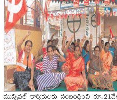
మున్సిపల్ కార్మికులకు సంబంధించి రూ.21వేలు