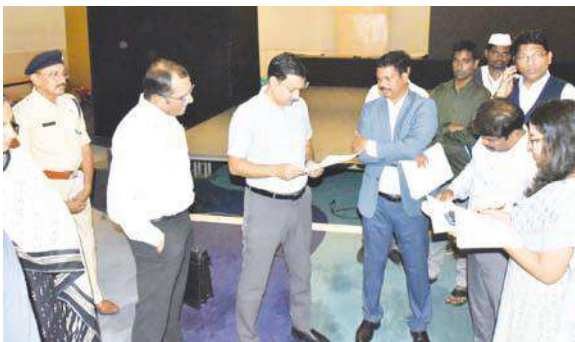
ఎన్టీఆర్ జిల్లా బ్యూరో, జనవరి 8, మేజర్ న్యూస్ : ఓటర్ల జాబితా ప్రత్యేక సంక్షిప్త సవరణ-2024, ఎన్నికల సన్నద్ధత కార్యక్రమాలపై