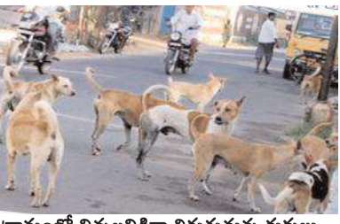
గ్రామంలో విచ్చలవిడిగా తిరుగుతున్న కుక్కలు