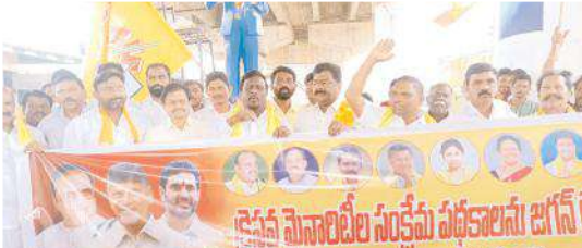
నిరసన తెలుపుతున్న దృశ్యం