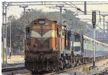
ఎక్స్ ప్రెస్ కు నంద్యాల నుంచి రిజిస్ట్రేషన్ కోటాను గణనీయంగా పెంచాలని కోరుతున్నారు.

మంత్రి కిషన్ రెడ్డి ఈ నెల 9వ తేదీన ప్రారంభించారని వారు వెల్లడించారు. ఈ రైళ్లకు సంబంధించిన టైంట్ బుక్ ఆదివారం విడుదల అయ్యే అవకాశం ఉందని వారు స్పష్టం చేశారు. డెమా ప్యాసింజర్ రైలును రేణిగుంట వరకు పొడగించడంతో నంద్యాల ప్రాంత శ్రీవారి భక్తులకు మంచి అవకాశం కాగా, అమరావతి ఎక్స్ ప్రెస్ రైలు నరసాపురం వరకు పొడగించడంతో కోనసీమ ప్రాంత పర్యాటకులకు ప్రయోజనకారిగా ఉంటుందని ప్రజలు హార్షం వ్యక్తం చేస్తున్నారు. అమరావతి