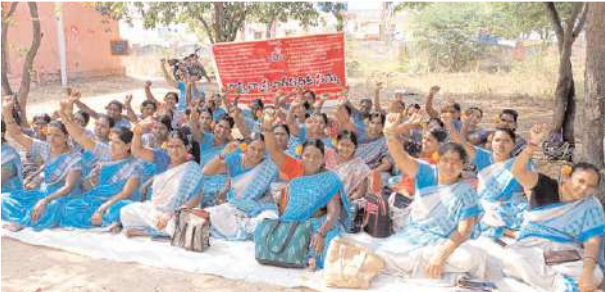
చెవిలో పూలతో నిరసన తెలుపుతున్న అంగన్వాడీలు