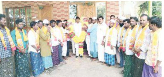
బీవీ సమక్షంలో పార్టీలో చేరుతున్న దృశ్యం

మాజీ ఎమ్మెల్యే బీవీ సమక్షంలో టిడిపిలో చేరిన 50 కుటుంబాలు