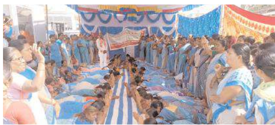
వేతనాలు పెంచమని పార్లు దండాలు పెడుతున్న అంగన్వాడీలు..

ఆలూరు,మేజర్ న్యూస్ : మా వేతనాలు పెంచు జగనన్నా నీకు పార్లు దండం పెడతాం అంటూ అంగన్ వాడీ మహిళలు,ఆలూరు ఆలూరు దీక్షా శిబిరంలో పొద్దుదండాలతో నిరసన చేపట్టారు. ఈ సందర్భంగా శుక్రవారం అంగన్వాడీల సమస్యలను పరిష్కరించాలని సీబీఐయే అధ్వర్యంలో 25వ రోజు చేపట్టిన సమ్మెలో భాగంగా ముఖ్యమంత్రి జగన్ అంగన్ వాడీలకు ఇచ్చిన హామీలను నెరవేర్చాలని సుప్రీంకోర్టు తీర్పు ప్రకారం కనీస వేతనం రూ.26000 ఇవ్వాలని ,రిటైర్మెంట్ బెనిఫిట్ 5లక్షలు,పెన్షన్ 50 శాతం ఇవ్వాలని, వర్తకు హెల్పులకు ప్రమోషన్ ఇవ్వాలని,భాషీగా ఉన్న సూపర్ వైజర్ పోస్టులను భర్తీ చేయాలంటూ తమ న్యాయమైన డిమాండ్లను పరిష్కరించాలని శాంతియుతంగా నిరసనలు,ధర్మాలు చేపడుతుంటే ప్రభుత్వం దారులకు,అరెస్టులు,నోటీసులు ఇవ్వడాని ఖండిస్తున్నా మన్నారు. గతంలో ప్రభుత్వాలకు మహిళలపై దాడులు చేయగా ప్రభుత్వాలను కూల్చివేసిన సంఘటనలు గుర్తు చేసుకోవాలని