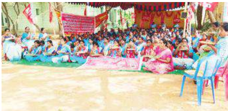
గడ్డి తింటూ నిరసన వ్యక్తం చేస్తున్న అంగన్ వాడీలు