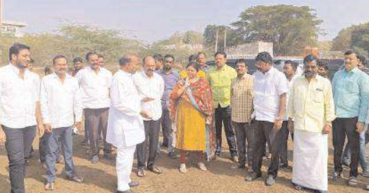
ఏర్పాట్లు పరిశీలిస్తున్న దృశ్యం

అఖిల నివాసంలో సమావేశమైన తెలుగుదేశం పార్టీ జిల్లా నాయకులు