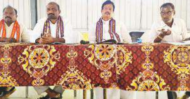
వేలం పాటలో పాల్గొన్న దృశ్యం