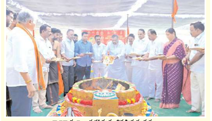
రాజాశ్యామలాంబ మహాయాగం నిర్వహిస్తున్న దృశ్యం