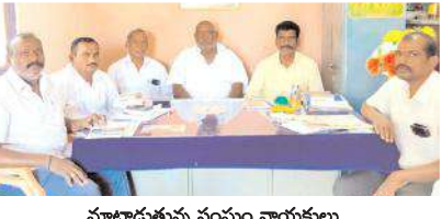
మాట్లాడుతున్న సంఘం నాయకులు