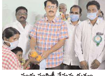
పండ్లు పంపిణీ చేస్తున్న దృశ్యం