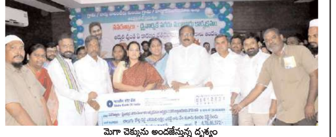
మొగ్గల మొగ్గల అందజేస్తున్న దృశ్యం

● కర్నూలు జిల్లా కలెక్టర్ జి.సృజన కర్నూలు, మేజర్ న్యూస్ ప్రతినిధి: అర్జులందరికీ సంక్షేమ పథకాలు అందాల్సినదే ప్రభుత్వ లక్ష్యమని జిల్లా కలెక్టర్ జి.సృజన అన్నారు. శుక్రవారం తాడేపల్లి క్యాంప్ కార్యాలయం నుంచి సవరణ ద్వైవార్షిక 5వ విడత నగదు పంపిణీలో భాగంగా అర్జులై ఉండి ఏ కారణం వైతనైనా లభి పొందని రాష్ట్రంలోని 68,990 మంది లబ్ధిదారులకు రూ. 97.76 కోట్లు సీఎం వైఎస్ జగన్ లబ్ధిదారుల ఖాతాల్లో జమ చేసే ప్రత్యక్ష ప్రసార కార్యక్రమాన్ని జిల్లా కలెక్టర్ జి.సృజన, కర్నూలు ఎంపీ