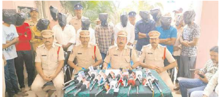
ముద్దాయిలను అరెస్ట్ చేస్తున్న డోన్ డివిజన్, సిఐ, ఎస్సైలు