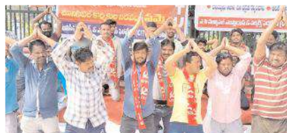
మాకాశ్ట్ర నిలబడి నిరసన తెలుపుతున్న దృశ్యం