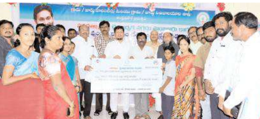
లబ్ధిదారులకు చెక్కును అందజేస్తున్న దృశ్యం

నంద్యాల కల్వరల్, మేజర్ న్యూస్ : సంక్షేమ పథకాలకు అర్హులైన ఉండి ఏ కారణంచేతనైనా లబ్ధి పొందని వారికి ద్వైవార్షిక నగదు మంజూరు కింద జిల్లాలో 2,585మంది లబ్ధిదారుల ఖాతాల్లో రూ. 4.02కోట్లు జమ చేశామని రాష్ట్ర వైసీపీ సంక్షేమ అభివృద్ధి ప్రభుత్వ సలహాదారు హబీబుల్లా తెలిపారు. శుక్రవారం తాడేపల్లి క్యాంపు కార్యాలయం నుంచి బటన్ నొక్కి నేరుగా వారి ఖాతాల్లో జమ చేసిన రాష్ట్ర ముఖ్యమంత్రి వైయస్ జగన్ కార్యక్రమాన్ని కలెక్టరేట్లోని వీడియో కాన్ఫరెన్స్ ద్వారా సంక్షేమ అభివృద్ధి ప్రభుత్వ సలహాదారుతో