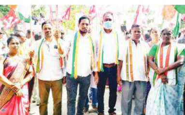
మద్దతు తెలుపుతున్న కాంగ్రెస్ నాయకులు