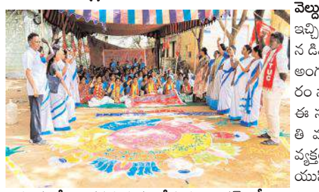
ముగ్గు వేసి నిరసన వ్యక్తం చేస్తున్న అంగన్ వాడీలు