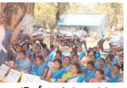
సంతకాలను సేకరిస్తున్న అంగన్ వాడీ, సిబిటియూ నాయకులు

అత్యుక్తారు, మేజర్ న్యూస్ : అంగన్ వాడీల న్యాయపరమైన సమస్యలు పరిష్కరించాలని, జగనన్నకు చెబు దాం అంటూ కోటి సంతకాల సేకరణ కార్యక్రమాన్ని చేపట్టి విస్తృతంగా నిరసన చేపట్టినట్లు అంగన్ వాడీ వర్కర్స్ యూనియన్ నాయకురాలు