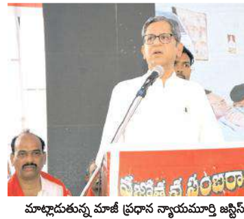
మాట్లాడుతున్న మాజీ ప్రధాన న్యాయమూర్తి జస్టిస్ ఎన్.వి.రమణ