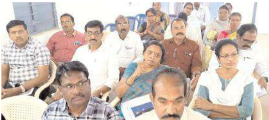
హాజరైన మండల పరిషత్ సభ్యులు

విద్య, వైద్యం, వ్యవసాయ రంగాలపై అత్యధిక ప్రాధాన్యత కల్పించి అనేక విప్లవాత్మక మార్పులను, బృహత్తర