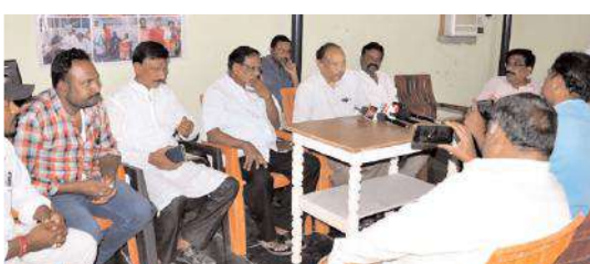
మాట్లాడుతున్న యాదవ సంఘం నాయకులు

కల్లూరు, మేజర్ స్వామి: యాదవులకు రాజకీయంగా ఏ పార్టీ ప్రాధాన్యతను ఇస్తుందో ఆ పార్టీకి యాదవుల సంపూర్ణ మద్దతు ఉంటుందని, లేని పోలో యాదవుల సత్తా చూపించే సమయం కూడా ఆసన్నమైందని యాదవ సంఘాల జేఏసీ స్పష్టం చేసింది. శుక్రవారం నగరంలోని ఆర్ఆర్ హాస్పిటల్లో నిర్వహించిన వలేఖరుల సమావేశంలో వారు మాట్లాడుతూ రాయలసీమలో 52నియోజక వర్గాల్లో వైసీపీ పార్టీ ఒక్క యాదవ కూడా టికెట్ కేటాయించకపోవడం శోచనీయమన్నారు. యాదవులు ఎమ్మెల్యేలుగా, ఎంపిలుగా పనికి రారా అని, ఎన్నికల్లో ఓట్లు వేసేందుకే పనికి వస్తామని అగ్రహం వ్యక్తం చేశారు. వైసీపీ జిల్లాలో యాదవులకు సీట్లు కేటాయించకపోవడం దారుణమన్నారు. టీడీపీ, జనసేన పార్టీలు అయిన యాదవులకు సముచిత స్థానం కల్పించాలని, లేని పక్షంలో ఈ పార్టీలకు కూడా