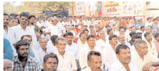
జయహోమా బిసి సభకు హాజరైన టీడీపీ శ్రేణులు