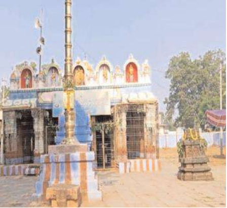
శ్రీ వనం లక్ష్మీ వేంకటేశ్వర స్వామి గుడి (పైలు ఫోటో) వెల్లిరూరర్, మేజర్ న్యూస్: పురాతన, ప్రాచీన, ప్రసిద్ధి చెందిన ఆలయాలలో ఆనాడు రాజులు వజ్రాలు, వైదుర్యాలు, బంగారు నాణేలు దొంగల భారి నుండి రక్షించేందుకు దాచిఉంటారన్న మూఢనమ్మకంతో నేడు అనేక దేవాలయాలు

లు దుండగుల దాడికి ద్వంసం అవుతున్నాయి. దేవుడు అంటే భయంలేక పోగా చివరికి దేవాలయంలో ఉలు కూపలుకూలేని రాతి విగ్రహం ఏమి చేస్తుందనే దురాలో చనలతో ఆలయాలను కొందరు దుండగులు గునపాలతో, యంత్రాల సాయంతో శిథిలం చేస్తున్నారు. ఆనాడు విదేశీయుల నుండి మన పూర్వీకులు దేవాలయాలను రక్షించుకోవడం ప్రాణాలను సైతం పన్నంగా పెట్టింటే నేడు స్వదేశానికి చెందిన వారే ఇలా దేవాలయాలను నిధి వేటలో దేవుళ్ళకి గుణపాల పోటు పొడవడం దారుణమనే చెప్పాలి.. ఇక అస్సలు విషయానికి వస్తే పత్తికొండ నియోజకవర్గంలోని వెల్లిరూర్ర మండలం, రామకృష్ణ గ్రామంలో వెలసిన శ్రీవనం వేంకటేశ్వరస్వామి ఆలయం ఎన్నో ఏళ్లనాటి పురాతనమైన, ప్రాచీనమైన దేవాలయం. ఇలాంటి ఆలయంలో కొందరు దుండగులు వజ్రాలు ఉంటాయనే దురుద్దేశ్యంతో గురువారం అర్ధరాత్రి ఆలయంలోని పచ్చల బండపై కప్పును ద్వంసం చేశారు. వజ్రాలు ఉన్నాయని దేవాలయం పై భాగంలో ఉండే బొంగరం లాంటి ప్రతిమను బద్దలు