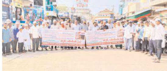
ధర్మా నిర్వహిస్తున్న విద్యార్థి సంఘాలు

గడివేముల, మేజర్ న్యూస్ : గడివేములలో జిందాల్ పరిశ్రమ భారీ లారీలు తిరిగితే సహించేది లేదని రాయలసీమ విద్యార్థి యువజన సంఘాల నేతలు భారీ ఎత్తున గడివేముల మండల కేంద్రంలో ఆందోళన, ధర్మా నిర్వహించారు. గురువారం గడివేములలో జిందాల్ ఫ్యాక్టరీకి సంబంధించిన లారీ డికోని మహిళా మృతి చెందిందని అలాగే గతంలో భారీ