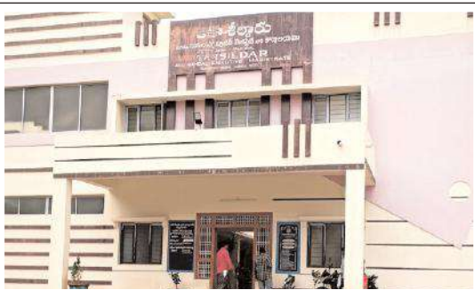
ఎమ్మిగనూరు తహశీల్దార్ కార్యాలయం

ఎమ్మిగనూరు, మేజర్ స్వామి: స్థానిక రెవెన్యూ కార్యాలయంలో శుక్రవారం రాత్రి ఇద్దరు అధికారుల మధ్య తీవ్ర స్థాయిలో వాగ్వాదం చోటు చేసుకుంది. ఓ స్థాయిలో కొట్టుకునేదాక వెళ్లగా తోటి ఉద్యోగులు అడ్డుగా వెళ్లి నివారించారు. వివరాల్లోకి వెళితే సినిమా ధియేటర్ల లైసెన్స్ రెవెన్యూపల్ విషయమే గొడవకు కారణమని తెలుస్తోంది. తహశీల్దార్ కార్యాలయంలోని ఓ అధికారి ధియేటర్ల లైసెన్స్ రెవెన్యూపల్ కోసం యజమానుల వద్ద ఓ మొత్తాన్ని డీల్ కుదుర్చుకున్నట్లు సమాచారం. ఈ నేపథ్యంలోనే రెవెన్యూపల్ విషయమై కింది స్థాయి అధికారిపై నిత్యం ఒత్తిడి పెంచుతున్నారు. డీల్ కుదుర్చుకున్న విషయాన్ని పసిగట్టిన కింది స్థాయి అధికారి లైసెన్స్ రెవెన్యూపల్ ఫైల్ పై జాప్యం చేస్తూ వస్తున్నాడు. దీంతో కోపోద్రిక్తుడైన పైస్థాయి అధికారి శుక్రవారం రాత్రి 7 గంటల సమయంలో కింది స్థాయి అధికారి పై ఇదే విషయమే అగ్రహం వ్యక్తం చేశారట. ఈ సందర్భంగా ఇరువురు మధ్య మాటామాట పెరిగి చివరికి డిమ్మ్యం.. డిమ్మ్యం స్థాయికి వెళ్ళింది. కార్యాలయంలో