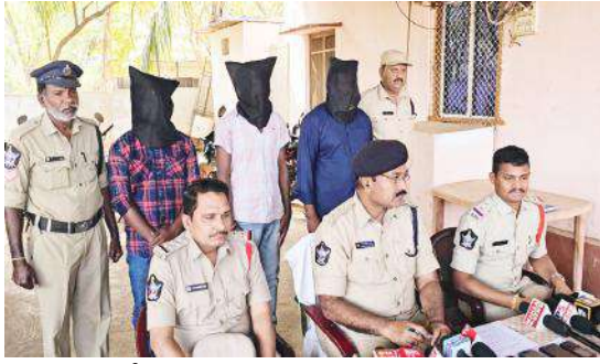
విలేజరుల ఎదుట నిందితులను ప్రదర్శిస్తున్న ధృశ్యం