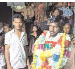
అమ్మవారికి మొక్కులు తీర్చుకుంటున్న భక్తులు