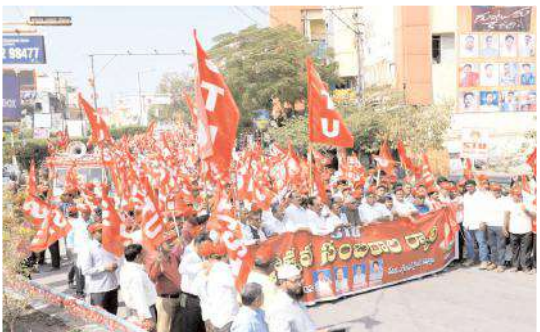
భారీ ర్యాలీ నిర్వహిస్తున్న ఉపాధ్యాయులు