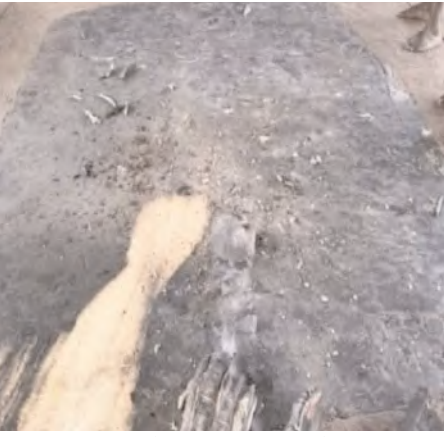
గుళ్ళి ఉన్న పచ్చల బండ (ఫోటో) తెలుస్తుంది. దీంతో గ్రామంలో ఎలాంటి పరిణామాలు చోటుచేసుకుంటాయోనని ప్రజలు భయాందోళనకు గురౌతున్నారు.