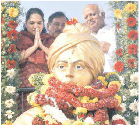
నివాళులర్పిస్తున్న కలెక్టర్ జి.సృజన