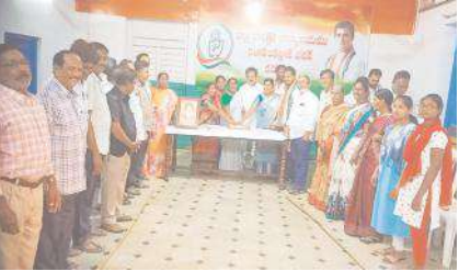
కేక్ కట్ చేస్తున్న దృశ్యం