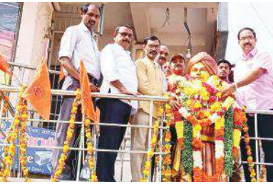
గ్రీన్ సాస్టెటి ఆధ్వర్యంలో ఘనంగా స్వామి వివేకానంద జయంతి వేడుకలు..