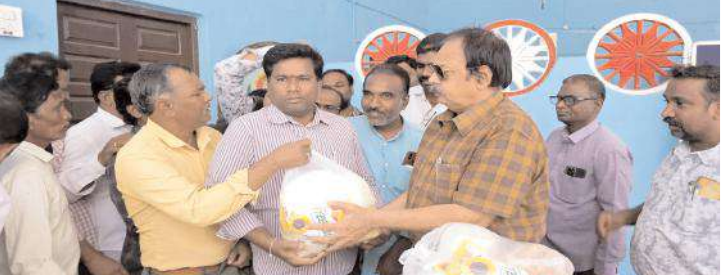
నిత్యావసర సరుకులు అందజేస్తున్న దృశ్యం