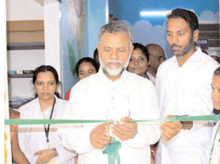
ఓపీ విభాగాన్ని ప్రారంభిస్తున్న ఎమ్మెల్యే జనాభా

ప్రజలకు మరింత మెరుగైన వైద్య సేవలను అందించేందుకు దాదాపుగా రూ.5కోట్ల 11లక్షలతో పలు అభివృద్ధి కార్యక్రమాలను చేపట్టామన్నారు. రూ.కోటి 6లక్షలతో నూతనంగా నిర్మించిన బాలల సత్కర చికిత్స కేంద్రం, మెడికల్ కళాశాలలో రూ.కోటి 50లక్షలతో లెక్చరర్ హాల్, నూతన ఓపీ రిజిస్ట్రేషన్ సెంటర్లను ప్రారంభించడం జరిగిందన్నారు. పేద ప్రజలకు కార్పొరేట్ వైద్యం అందించేందుకు అన్ని నౌకర్యాలను కల్పిస్తున్నామని, అలాగే స్పెషలిస్టు వైద్యులు, వైద్య సిబ్బందిని అన్ని వేళలా అత్యవసర సేవలను అందించేందుకు అందుబాటులో ఉంచామన్నారు. నేడు జరుగుతున్న వైద్య సేవ గురించి ప్రజలకు వీడియోల ద్వారా పలు మాధ్యమాల ద్వారా అవగాహన కల్పించి వైద్య సేవ వినియోగం చేసుకోనేలా చర్యలు చేపట్టాలని సూచించారు. వైద్య సేవల్లో భాగంగా ప్రతి 50వేల మంది