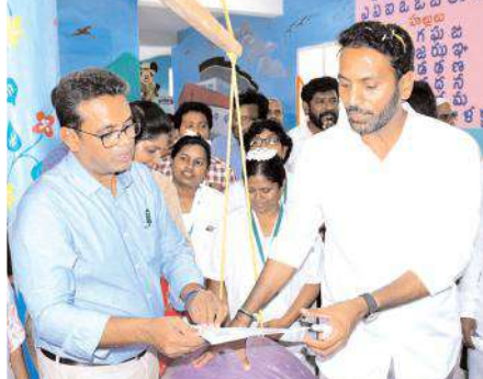
చిన్నారులకు సంబంధించి వైద్యులను అడిగి తెలుసుకుంటున్న ఎమ్మెల్యే

జనాభా కలిగిన పట్టణ ప్రాంతాల్లో వైయస్సార్ అర్బన్ సెంటర్లను ఏర్పాటు చేశామని సీమాచీసెల నిర్మాణం చేపడుతున్నామన్నారు. సూపర్ స్పెషాలిటీ వైద్య సేవలను అందించేందుకు చర్యలు తీసుకుంటామని తెలిపారు. జగన్మోహన్ సురక్ష అనే బృహత్తర కార్యక్రమం ద్వారా పేద ప్రజలకు ఉచిత వైద్య పరీక్షలను నిర్వహించి ముందస్తుగా చికిత్సలను అందించేందుకు కార్యక్రమం చేపట్టామని తెలిపారు. ఆరోగ్యశ్రీ ద్వారా 3వేలకు పైగా ఉన్న రోగులకు చికిత్సలు, చికిత్స ఆపరేషన్లను నిర్వహిస్తున్నామని అందుకు గాను రూ.25లక్షల వరకు వైద్య చికిత్సలు వినియోగించుకొనే నౌకభ్యం ప్రభుత్వం కల్పించిందన్నారు. భవిష్యత్తులో నంద్యాలలోనే అన్ని చికిత్సలకు వైద్య సేవలను అందించే రీతిలో అభివృద్ధి చేస్తామని తెలిపారు.