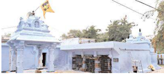
తాండవ మల్లేశ్వర స్వామి ఆలయం

కొత్తపల్లి, మేజర్ న్యూస్ : మండల కేంద్రమైన కొత్తపల్లిలో వెలిసిన తాండవ మల్లేశ్వర స్వామి మహిమ గల దేవుడుగా విరాజిల్లుతున్నాడు. ఈ ఆలయానికి ఎంతో చరిత్ర ఉన్నది. సుమారు 5 వేల సంవత్సరాల క్రితం ఈ ఆలయంను నిర్మించినట్లు పురావస్తు శాస్త్రవేత్తలు తెలుపుతున్నారు. జనమేయ మహారాజు కాలంలో ఈ ఆలయం నిర్మితమైనట్లు శాసనాల ద్వారా తెలుస్తుంది. శ్రీశైలంలో ఉన్న శివలింగాన్ని తాండవ మల్లేశ్వర స్వామి ఆలయంలో వెలిసిన శివలింగం పోలి ఉంటుంది. అందువల్ల ఈ ఆలయంలో వెలిసిన శివలింగానికి ప్రత్యేక చరిత్ర ఉంది. ఈ