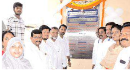
ప్రభుత్వ వైద్యశాలలో నూతనంగా నిర్మించిన ఓపీ, బాలల సత్కర చికిత్సా కేంద్ర శిల్పారవి ద్వారా ఆవిష్కరిస్తున్న ఎమ్మెల్యే, ఎమ్మెల్సీ తదితరులు