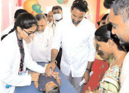
చిన్నారుకి వైద్య పరీక్ష చేస్తున్న విద్యాని పరిశోధిస్తున్న ఎమ్మెల్యే, ఎమ్మెల్సీ

కొత్తపల్లిలో వెలిసిన తాండవ మల్లేశ్వర స్వామి ఉత్సవాలు ఈ నెల 14 నుంచి 17వ తేదీ వరకు నిర్వహిస్తున్నట్లు దేవస్థానం అధికారులు తెలిపారు. 14న స్వామి వార్లకు బిందె సేవ, గణపతి పూజ, అంకురార్పణ ఉంటుందని అన్నారు. 15న తాండవ మల్లేశ్వర స్వామికి, పార్వతీదేవికి కళ్యాణ మహోత్సవం నిర్వహించనున్నారు. 16న ప్రబోత్సవం, 17న ఉత్సవమూర్తులకు పల్లకి సేవ, పార్వతి కార్యక్రమాలతో ఉత్సవాలు ముగియనున్నాయి. ఈ ఉత్సవాల సందర్భంగా గ్రామంలో పలు క్రీడా పోటీలు నిర్వహిస్తున్నారు. ఈ పోటీల్లో గెలుపొందిన వారికి బహుమతులు అందజేయనున్నారు. ఈ ఉత్సవాలను తిలకించేందుకు మండలంలోని అన్ని గ్రామాల ప్రజలు తరలిరానున్నారు.