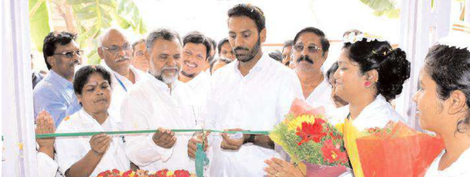
బాలల సత్కర చికిత్సా కేంద్రాన్ని ప్రారంభిస్తున్న ఎమ్మెల్యే శిల్పారవి