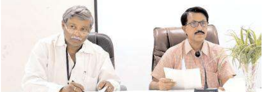
సమావేశంలో మాట్లాడుతున్న జిజిహెచ్ సూపరింటెండెంట్