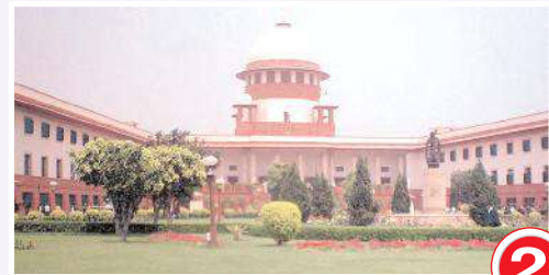
సుప్రీం కోర్టు భవనం