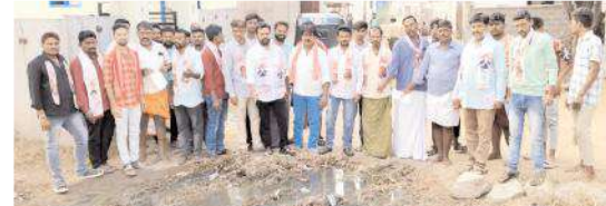
రోడ్డుపై నిల్వ ఉన్న మురికినీటిని చూపిస్తున్న జనసేన నాయకులు