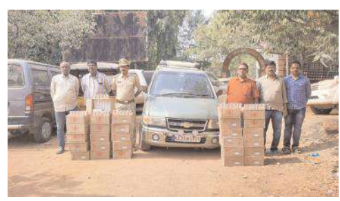
స్వాధీనం చేసుకున్న మద్యంతో పోలీసులు