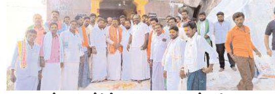
దేవాలయంలో పార్టీ నాయకులు, కార్యకర్తలతో విరుపాక్షి