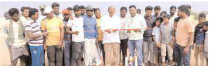
క్రికెట్ టోర్నమెంట్ ప్రారంభిస్తున్న వైసీపీ మండల కన్వీనర్

మంత్రాలయంరూరల్, మేజర్ న్యూస్ : మంత్రాలయం మండల పరిధిలో రాంపురం గ్రామంలో వెలసిన శ్రీరామలింగేశ్వరస్వామి జాతర, సంక్రాంతి పండుగ సందర్భంగా, 52 బసాపురం గ్రామంలో ఎమ్మెల్యే