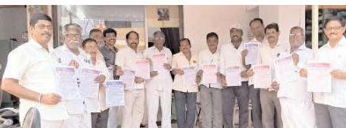
రథయాత్ర కరపత్రాలను విడుదల చేస్తున్న బిసి నాయకులు

బిసిల తలరాతలు మారలేదని ఆవేదన వ్యక్తం చేశారు. ఎన్ని ప్రభుత్వాలు మారినా, ఎంతమంది నాయకులు మారినా బిసి తలరాతలు మారడం లేదని, ఎక్కడ వేసిన గొంగళి అక్కడే అన్న చందంగా బిసిలు దయనీయ స్థితిలో ఉన్నారని అన్నారు. బిసిల రాతలు మారాలన్నా, నేతలు మారాలన్నా మన ఆలోచన విధానం మారాలని, సమసమాజ