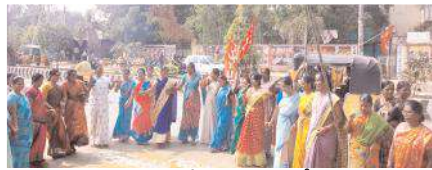
నిరసనలు చేస్తున్న అంగన్వాడీలు

నంద్యాల రూరల్, మేజర్ న్యూస్ : అంగన్వాడీల తమ న్యాయమైన డిమాండ్ల సాధన కోసం నంద్యాల పట్టణంలో చేపడుతున్న నిరసన దీక్షలు ఆదివారంతో 34వ రోజుకు చేరుకున్నాయి.