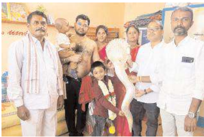
అలయ ఈటకు వెండి పడిగి అందజేస్తున్న భక్తులు

- 1.149 కి.గ్రా వెండి పడిగి - అన్నదానానికి రూ.1.50 లక్షలు