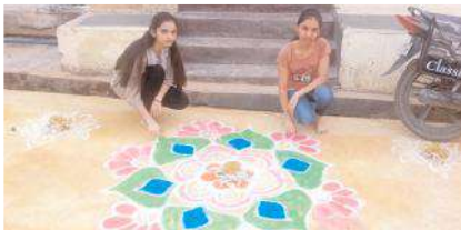
ముగ్గులు వేస్తున్న బిన్నార్లు

తుగ్గలి, మేజర్ న్యూస్: మండలంలోని అన్ని గ్రామాల్లో ఆదివారం భోగి పండుగను ప్రజలు ఘనంగా జరుపుకున్నారు. పండుగ సందర్భంగా పట్టణాల్లో ఉండే వారంతా తమ సొంత గ్రామాలు, పల్లెలకు చేరుకోవడంతో గ్రామాల్లో సందడి కనిపించింది. ఉదయాన్నే తమ ఇళ్ల వద్ద భోగి మంటలు వేసి