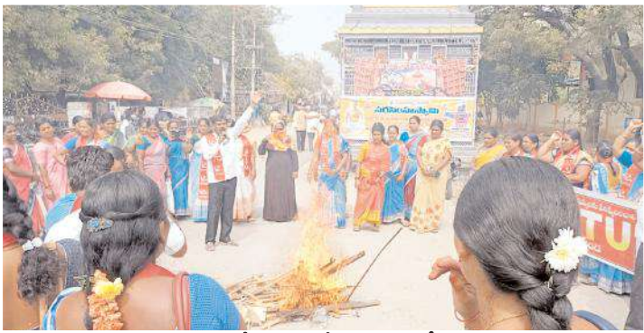
జి.ఓ కాపీలను దగ్గం చేస్తున్న అంగన్వాడీలు