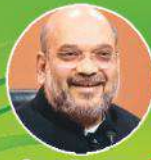
శ్రీ ఎమ్మెల్యే షా గారు వైసీపీ మంత్రి