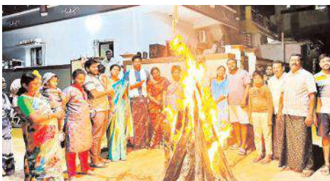
భోగి మంటల దృశ్యం