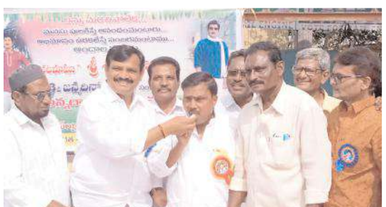
కేక్ కట్ చేసి వేడుకలు నిర్వహిస్తున్న దృశ్యం

నంద్యాల రూరల్, మేజర్ న్యూస్ : సీని నటుడు శోభన్ బాబు 88వ జయంతి వేడుకలను శోభన్ బాబు సేవా సమితి నంద్యాల ప్రెసిడెంట్