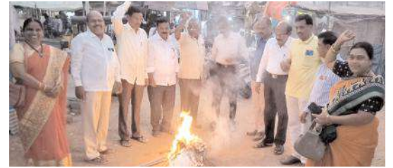
పత్రికల్లో వచ్చిన క్లిప్పలను దహనం చేస్తున్న యుటిఎఫ్ నాయకులు