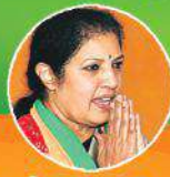
శ్రీ మతి దర్శనాబి పురందేశ్వరీ గారు జిజీవీ రాష్ట్ర అధ్యక్షురాలు