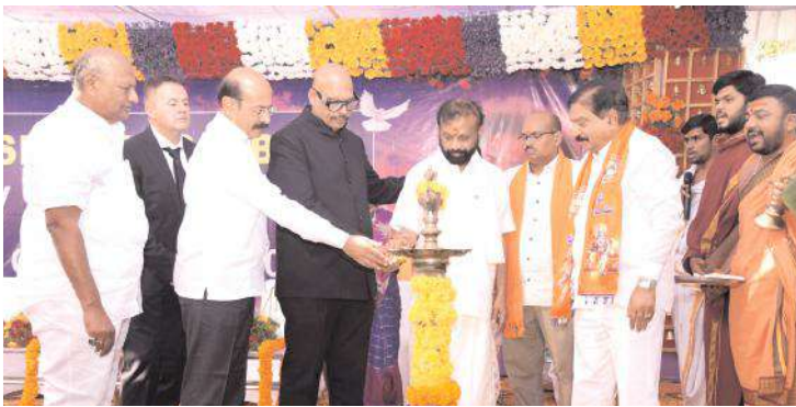
జ్యోతి ప్రజ్వలన చేస్తున్న దృశ్యం