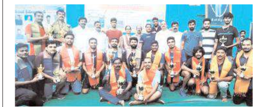
పోటీల్లో గెలుపొందిన విజేతలు