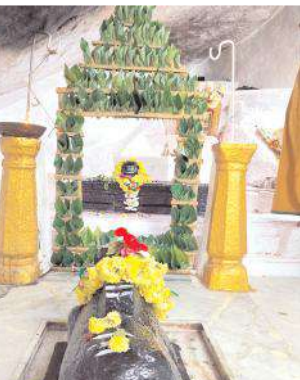
ఆకుల ఆలంకరణలో శ్రీ సిద్దేశ్వరస్వామి