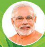
శ్రీ నరేంద్రబాబు గారు ప్రధాన మంత్రి