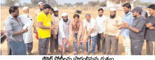
క్రికెట్ టోర్నమెంట్ ప్రారంభిస్తున్న దృశ్యం