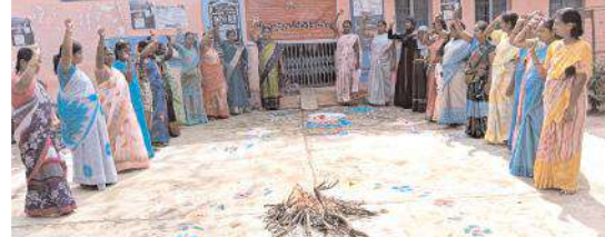
భోగి మంటల ద్వారా తమ నిరసన తెలుపుతున్న అంగన్ వాడీలు