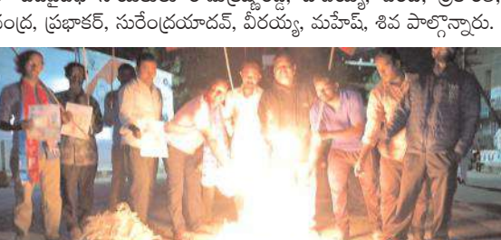
భోగి మంటల వద్ద నిరసన వ్యక్తం చేస్తున్న రైతు సంఘం నాయకులు