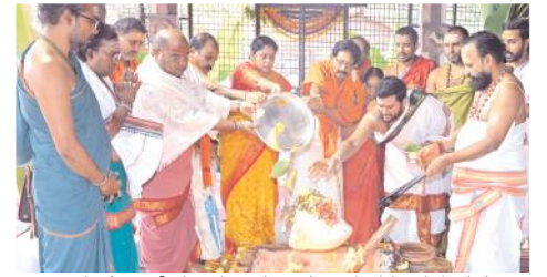
హోమా గుండానికి పూర్ణాహూతి పూజ ద్రవ్యాలను సమర్పిస్తున్న ధృత్యం

నేటితో ముగియనున్న సంక్రాంతి బ్రహ్మోత్సవాలు శ్రీశైలం క్షేత్రంలో వైభవంగా నిర్వహిస్తున్న సంక్రాంతి బ్రహ్మోత్సవాలు గురువారంతో ముగియనున్నాయి. శ్రీస్వామి అమ్మవార్లకు అశ్వవాహనసేవ, ఆలయ