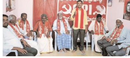
మాట్లాడుతున్న సీపీఐ నాయకులు