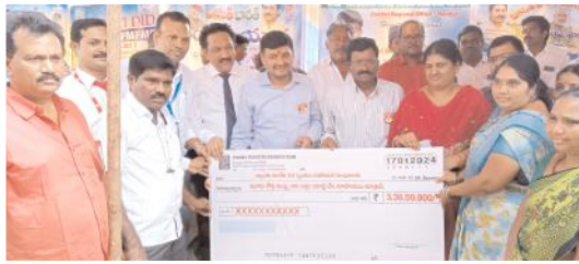
పొదుపు సంఘాల మహిళలకు చెక్కును అందజేస్తున్న దృశ్యం