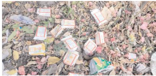
ఓ గ్రామంలో ఖాళీ కర్ణాటక మద్యం ప్యాకెట్లు

వారి ఖాతాకు ఎంత జమ అవుతుందో మరీ. ప్రతి గ్రామానికి ఒక పోలీసును నియమించారు. అంతేకాకుండా సచివాలయంలో మహిళా పోలీసు కూడ ఉంటారు. వీరికి సమాచారం ఉంటుంది కదా మరీ.. ఈ అక్రమ మద్యం విక్రయాలు ఎందుకు నియంత్రించడం లేదో ఆ భగవంతుడికే ఎరుక... నిత్యం వాహనాల తనిఖీపై పెట్టే శ్రద్ధ అక్రమ మద్యంపై ఎందుకు పెట్టడం లేదని ప్రజలు ప్రశ్నిస్తున్నారు. వాహనాలు తనిఖీ చేస్తున్న పోలీసులకు కర్ణాటక నుంచి మద్యంతో గ్రామాలకు వెళ్లే వాహనాలు కనిపించడం లేదా... కనిపించినా రైట్ రైట్ అంటున్నారా.. ఏది ఏమైనా ఉన్నతాధికారులు దృష్టి సారించి మద్యం మత్తులో ఉన్న గ్రామాలను కాపాడాల్సిన బాధ్యత ఎంతైనా ఉందని మందుబాబుల కుటుంబ సభ్యులు కోరుకుంటున్నారు. సార్వత్రిక ఎన్నికలు సమీపిస్తున్న మేర కర్ణాటక మద్యాన్ని నియంత్రించకుంటే సమస్యలు తప్పవని పలువురు మేధావుల వాదన.