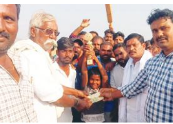
విజేతకు ట్రోఫీ, నగదును అందిస్తున్న నాయకులు, నిర్వహకులు