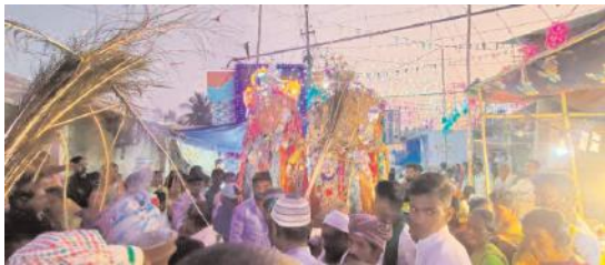
స్వామివారిని ఊరేగింపుగా తీసుకెళ్తున్న దృశ్యం బండిఆత్మీకారులు, మేజర్ న్యూస్: సంక్రాంతి పండుగ సందర్భంగా మండలంలోని పెద్ద దేవాలవారం గ్రామంలో చిన్న బాదుల్లా స్వామి, పెద్ద బాదుల్లా స్వామి, మునిమంద లింగమయ్య స్వామి వార్ల సరిగెత్తు భక్తి

శ్రద్ధలతో కుల, మతాలకు అతీతంగా గ్రామ ప్రజలందరూ అంగరంగ వైభవంగా జరుపుకున్నారు. మూడు రోజులపాటు చిన్న బాదుల్లా స్వామి, పెద్ద బాదుల్లా స్వామి వావిడిలో కొలువుదీరి భక్తులకు దర్శనమిచ్చారు. గ్రామ ప్రజలే కాకుండా చుట్టుప్రక్కల ప్రాంతాల నుంచి స్వామి వారి దర్శనార్థం వచ్చిన భక్తులు మొక్కులు తీర్చుకోవడం జరిగింది. మంగళవారం సాయంత్రం నుంచి బుధవారం వేకువజాము వరకు స్వామివారికి మొక్కులు తీర్చుకొని భక్తులు కాసుకలు సమర్పించుకున్నారు. బుధవారం సాయంత్రం మేళతాళాలు, డప్పు వాయిద్యాల మధ్య అంగరంగ వైభవంగా గ్రామ ప్రజలందరూ కలిసి ఊరేగింపుగా తీసుకెళ్లడం జరిగింది. ఈ కార్యక్రమంలో గ్రామ పెద్దలు, భక్తులు పెద్దఎత్తున పాల్గొన్నారు.