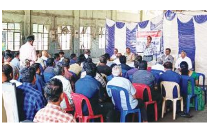
మాట్లాడుతున్న డిపో మేనేజర్