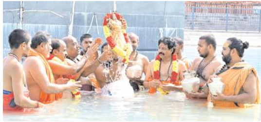
పుష్పరిణిలో శాస్త్రోక్తంగా అపబ్లుధస్నానం నిర్వహిస్తున్న ధృత్యం

మండపంలో సదస్యం, నాగవల్లి కార్యక్రమాలు జరిపించారు. సదస్యం కార్యక్రమంలో వేదపండితులచే వేదస్వస్తి, నిర్వహించబడింది. నాగవల్లి కార్యక్రమంలో సంక్రాంతి