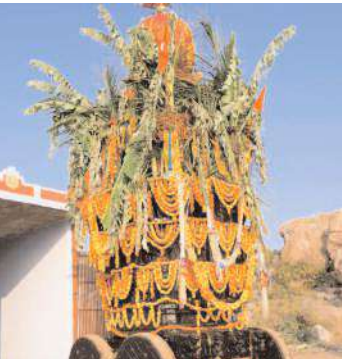
రథోత్సవానికి సిద్ధంగా ఉన్న రథం