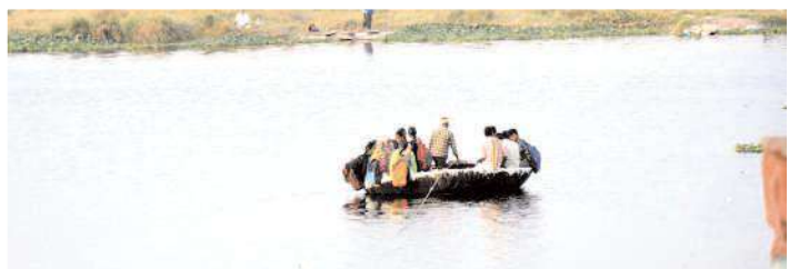
తెప్ప సాయంతో నది దాటుతూ పాఠశాలలు, కళాశాలకు వస్తున్న విద్యార్థిని, విద్యార్థులు