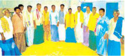
మాట్లాడుతున్న టీడీపీ నాయకులు