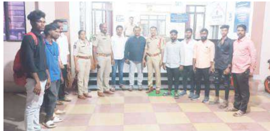
సదరు బండ్లకు 15000 రూపాయలు జరిమానా విధించడమైనది.