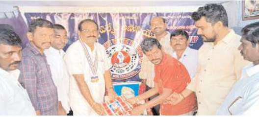
దుప్పట్లు పంపిణీ చేస్తున్న దృశ్యం

నంద్యాలఅర్బన్, మేజర్ న్యూస్ : నంద్యాల పట్టణం జగజ్జననీ నగర్ లోని డిజిటల్ రైన్ వెల్ఫేర్ అసోసియేషన్ మరియు రోటరీక్లబ్