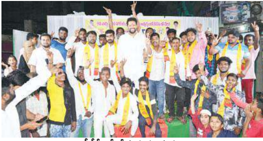
టీడీపీలో చేరుతున్న దృశ్యం

కర్నూలు, మేజర్‌న్యూస్ ప్రతినిధి : కర్నూలులో ఉన్న ముస్లిం సోదర సోదరిమణులందరూ తెలుగుదేశం పార్టీకి మద్దతు ఇస్తున్నారని