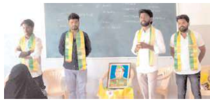
నేతాజీ నివాళులర్పిస్తున్న ప్రజా ఆత్మగౌరవ వేదిక నాయకులు