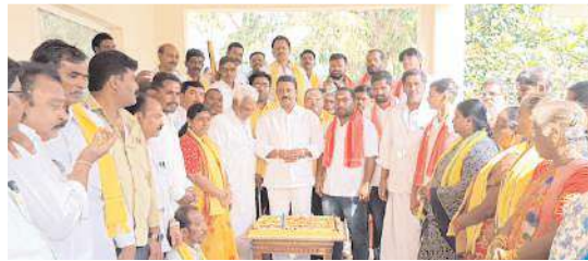
నారా లోకేష్ జన్మదిన సందర్భంగా కేక్ కట్ చేస్తున్న దృశ్యం