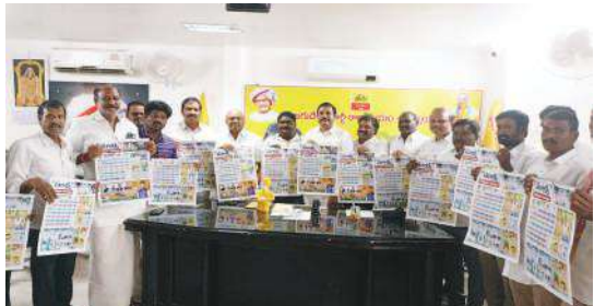
సూర్య దినపత్రిక క్యాలెండర్ ను ఆవిష్కరిస్తున్న దృశ్యం కర్నూలు రూరల్, మేజర్ స్కూల్స్ : కర్నూలు నగరంలోని తెలుగుదేశం పార్టీ కార్యాలయంలో మంగళవారం కర్నూలు పార్లమెంటు టీడీపీ అధ్య