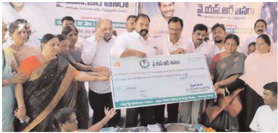
పాదుపు మహిళలకు ఆసరా చెక్కు అందజేస్తున్న ధృత్యం

మంచి సంక్షేమ పథకాలను అందించే ఘనత ముఖ్యమంత్రి వైయస్ జగన్ దేవ్ చంద్రబాబు బూటకపు హామీలను నమ్మడం రెడ్ బుక్ పేరుతో లోకేష్ అధికారులను బెదిరిస్తున్నారు..