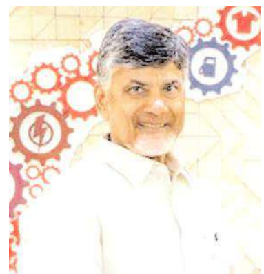
కలిగిస్తున్నారన్నారు. కావునా టీడీపీ నాయకులు, కార్యకర్తలు, అభిమానులు పెద్ద ఎత్తున రావాలని ఆయన కోరారు.

అరాచక, అవినీతి, అక్రయ, హత్యా రాజకీయాలు, కూల్చివేతలు, దాడులతో జగన్ రెడ్డి పాలన సాగిందన్నారు. 2024 ఎన్నికల్లో ప్రజాస్వామ్యాన్ని కాపాడాలని, ప్రజలను అప్రమత్తం చేసేందుకే తెలుగుదేశం పార్టీ జాతీయ అధ్యక్షుడు నారా చంద్రబాబునాయుడు రా.. కదలిరా ని నాదంలో రాష్ట్రంలోని అన్ని నియోజకవర్గాల్లో బహిరంగ సభలు నిర్వహిస్తూ ప్రజల్లో చైతన్యం