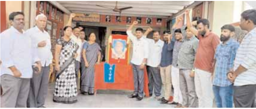
హైదరాబాద్ మేజర్ స్వ్యాస్ :: భారత స్వాతంత్ర్య సంగ్రామ యోధుడు, యువతరానికి స్ఫూర్తిదాత, నవతరానికి మార్గదర్శి నేతాజీ సుభాష్ చంద్రబోస్ 127వ జయంతి ని అని అఖిల భారత యువజన సమాఖ్య హైదరాబాద్ జిల్లా సమితి ఆధ్వర్యంలో హిమాయత్ నగర్ లోని సత్యనారాయణ రెడ్డి భవన్

ఏఐఐఎస్ ఆధ్వర్యంలో ఘనంగా సుభాష్ చంద్ర బోస్ 127వ జయంతి