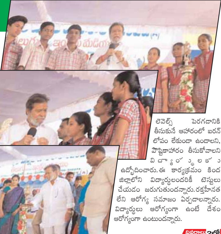
లవెల్స్ పెరగడానికి తీసుకునే ఆహారంలో ఐరన్ లోపం లేకుండా ఉండాలని, హెమిక్రూరం తీసుకోవాలని విద్యార్థులకు మంత్రి ఉద్ఘోషించారు. ఈ కార్యక్రమం కింద జిల్లాలోని విద్యార్థులందరికీ టెస్టులు చేయడం జరుగుతుందన్నారు. రక్తహీనత లేని ఆరోగ్య సమాజం ఏర్పడాలన్నారు. విద్యార్థులు ఆరోగ్యంగా ఉంటే దేశం ఆరోగ్యంగా ఉంటుందన్నారు.