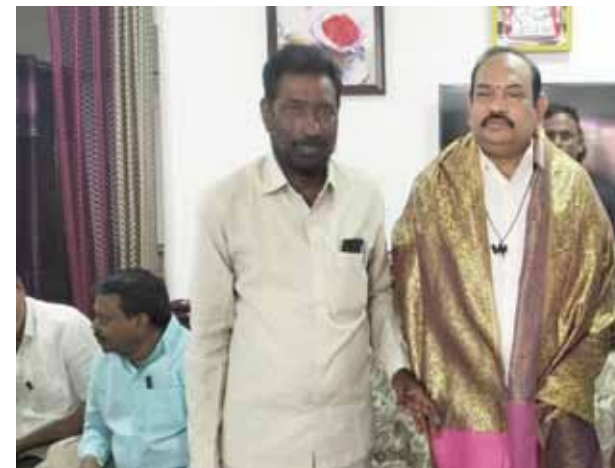
గెలుపే లక్ష్యంగా కష్టపడి పనిచేస్తాం:యల్లా చెంచు