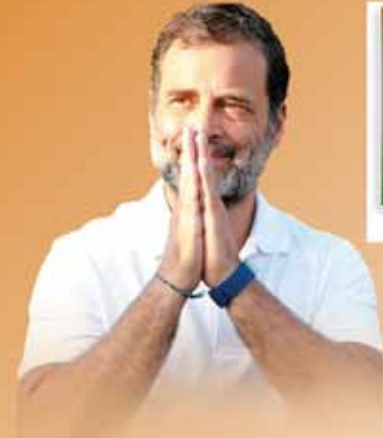
Shri Rahul Gandhi