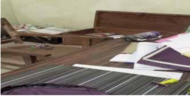
వింజమూరు మేజర్ న్యూస్ వింజమూరు మండలంలో రైతులే లక్ష్యంగా వరుస దొంగతనాలు జరుగుతున్నాయి. పంట పొలాల్లోని విద్యుత్ మోటార్లు వైర్లు

ట్రాన్సార్మర్లు సోలార్ ప్యానల్ రోజుకు ఒక పంచాయతీలో దొంగలు చోరీలకు పాల్పడుతున్నారు. నెల రోజులుగా వరుస దొంగతనాలు జరుగుతున్నప్పటికీ పోలీసుల నుండి స్పందన కరువైంది. బాధితులు ఎన్నిసార్లు పోలీస్ స్టేషన్లో ఫిర్యాదు చేసిన కేసులు నమోదు చేయడం లేదని రైతుల ఆవేదన వ్యక్తం చేస్తున్నారు. పరిమినుము పొగాకు శెనగ జొన్న వివిధ రకాల పైర్లు సాగులో ఉండగా విద్యుత్ ఉపకరణాల దొంగతనాల బెడద రైతులను వెంటాడుతుంది అందులో భాగంగానే నాలుగు రోజుల క్రితం ఇరిగేషన్ కార్యాలయం బుధవారం రాత్రి వ్యవసాయ శాఖ కార్యాలయం లో దొంగతనాలు జరగడం పరిపాటిగా మారింది ప్రభుత్వ కార్యాలయాలలో దొంగలు పడితే విలువైన రికార్డులు పోతాయనే భయం అధికారుల్లో నెలకొంది. సీరియల్ దొంగతనాలపై ఇప్పటికైనా పోలీసులు సమగ్రమైన విచారణ జరిపి తమకు అండగా నిలవాలని రైతులు అధికారులు కోరుకుంటున్నారు.