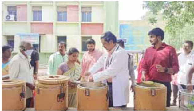
- పెద్ద ఎత్తున అన్నదాన కార్యక్రమం