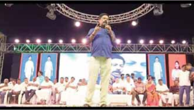
స్వర్ణముఖి నదికి సంక్రాంతి శోభ.