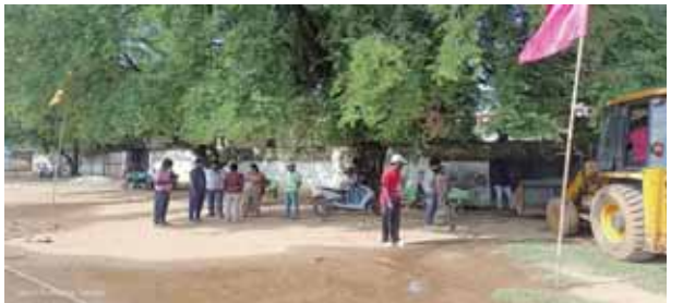
పనిలో పడగా ఎట్టకేలకు ఆసుపత్రి సూపరింటెండెంట్, పారిశుధ్య సిబ్బందిని అక్కడకి పంపించి శుభ్రం చేయించారు. గూడూరు ఆర్డీఓ అయినా స్పందించి ప్రభుత్వ ఆసుపత్రి లోని మురికి నీరు, సిమెంట్ కలిపిన నీటిని స్టేడియంలోకి రాకుండా ఉండే విధంగా చర్యలు తీసుకోవాలని కోరుతున్నారు.

గూడూరు, మేజర్ స్యూస్ ప్రభుత్వ ఆసుపత్రి అధికారుల, నిర్మాణంలో ఉన్నగుత్తేదారుల నిర్లక్ష్యంతో ప్రభుత్వ క్రీడా ప్రాంగణం మురుకి కూపంగా మారుతోందని ఆవేదన చెందుతున్నారు. క్రీడా ప్రాంగణంలో నిత్యం చిన్నారులు ఆటలు, పలు క్రీడలకు శిక్షణ కార్యక్రమాలు ఉదయం సాయంత్రం సమయాల్లో నడిచేందుకు పదుల సంఖ్యలో వాకర్స్ నిత్యం వస్తుంటారు. అయితే ప్రభుత్వ ఆసుపత్రి వైపున మురికి నీరు క్రీడా ప్రాంగణంలోకి వస్తున్నట్లు ఫిర్యాదు చేసినా పట్టించుకోక పోవడంపై ఆవేదన వ్యక్తం చేస్తున్నారు. డయాలోసిస్ కేంద్రం పక్కన కొత్త భవనం నిర్మాణంలో వస్తున్న నీళ్లు, స్టేడియంలోకి వదులుతున్నారు. అదే విధంగా మర్చురీ నుంచి వ్యర్థ జలాలు, ఆసుపత్రి నుంచి వచ్చే వ్యర్థ జలాలు కూడ స్టేడియంలో వస్తున్నట్లు పేర్కొంటున్నారు. సూపరింటెండెంట్ను అడిగినా సమాధానం లేదని తెలియచేస్తున్నారు. సంక్రాంతి క్రీడా పోటీల్లో ఉన్న వాళ్లు శుభ్రం చేసుకునే