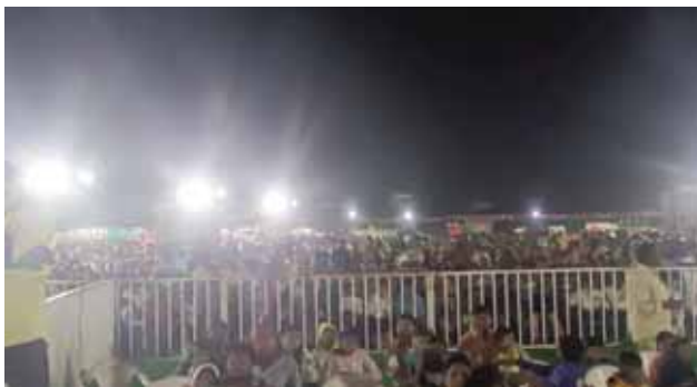
స్వర్ణముఖి నదికి సంక్రాంతి శోభ.