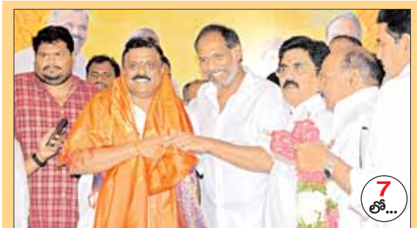
ఘనంగా ఎమ్మెల్యే అనగాని జన్మదినోత్సవం