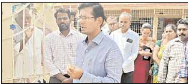
ఓబులకృపల్లిలో పోలింగ్ కేంద్రాన్ని పరిశీలించిన కలెక్టర్... మండలంలోని ఓబులకృపల్లి గ్రామంలోని మండల పరిషత్ ప్రాధమికోన్నత