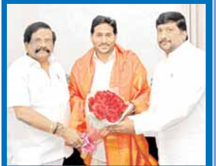
ఒంగోలు నుంచి మాజీ మంత్రి శిర్డా కుటుంబాన్ని పోటీలోకి దించనున్న వైకాపా

జాబితాను సిద్ధం చేసింది. ప్రకాశం జిల్లాలోని 8 నియోజక వర్గాలకు అభ్యర్థులను ఖరారు చేసే పనిని వైకాపా అధిష్టానం పూర్తి చేసింది. ఇప్పటికే కొండపి, సంతనూతలపాడు నియోజక వర్గాలలో ఇన్‌చార్జ్‌లను మార్చి మంత్రులుగా ఉన్న ఆదిమూలపు సురేష్, మేరుగ నాగార్జున కు బాధ్యతలను అప్పజెప్పింది. అనంతరం దర్శి నుంచి సిట్టింగ్ ఎమ్మెల్యే మద్దిశెట్టిని దూరంపెట్టి మాజీ ఎమ్మెల్యే బూచేపల్లి శివప్రసాద్‌రెడ్డికి గ్రీన్‌సిగ్నల్ ఇచ్చింది. గిద్దలూరు ఎమ్మెల్యే అన్నా రాంబాబు తాను పోటీ చేయనని ప్రకటించడంతో అక్కడ ఎవరిని బరిలో దించాలనే అంశంపై సుదీర్ఘ చర్చ జరిగింది. ఇదే సమయంలో మార్కాపురంలో రెండు వర్గాలు, కనిగిరిలో స్థానిక నాయకులు మధ్య