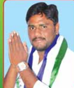
అత్తిల జవీస్ యం.పి.పి., పి.సి.పల్లి మండలం