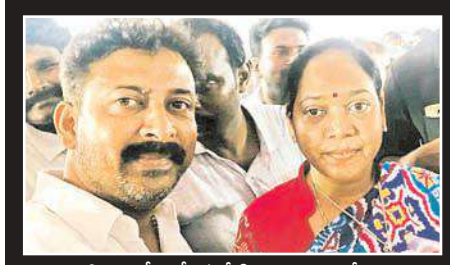
ఎమ్మెల్యే మేకతోటి సుచరితతో...

నెగ్గించుకునేలా వ్యవహరించడంతో సీఎం బాలినేని విషయంలో తీవ్ర నిర్ణయం తీసుకున్నట్లు సమాచారం. ఈ క్రమంలో సజ్జల బాలినేనితో సీఎం జగన్మోహన్ రెడ్డి తెలిపిన విషయాలను తెలపడంతో బాలినేని షాక్ కు గురయ్యారు. ఒంగోలు ఎంపిగా చెవిరెడ్డి భాస్కర్ రెడ్డి పోటీ చేస్తారని అంతేకాక ప్రకాశం బాధ్యతలు అన్ని ఇక నుంచి చెవిరెడ్డి భాస్కర్ రెడ్డి చూస్తారని కుండబద్దలు కొట్టేశారు. అయితే వైకాపా అధిష్టానం ఒంగోలు ఎమ్మెల్యేగా వైవి సుబ్బారెడ్డి సూచించిన వారికి టిక్కెట్ ఇచ్చే ఆలోచనలో ఉంది. సీఎం జగన్ నిర్ణయాలకు కంగుతిన్న బాలినేని పార్టీ అధిష్టానంతో మీ పార్టీకి మీకో నమస్కారం అంటూ చెప్పినట్లు సమాచారం. ప్రకాశంపై పట్టుకోసం బాలినేని చేసిన ప్రయత్నాలు బెడిసికొట్టడంతో పాటు చెవిరెడ్డి భాస్కర్ రెడ్డి ఆదేశాలలో పని చేయడం నచ్చని బాలినేని వైకాపాకు గుడ్ బై చెప్పి అవకాశాలు ఉన్నాయని పార్టీ వర్గీయులు భావిస్తున్నారు.