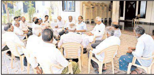
గద్దె దించాల్సిన అవసరం ఉందని ఆదిశగా పనిచేయాలని నేతలకు దిశానిర్దేశం చేశారు. ఈ కార్యక్రమంలో పలువురు తెలుగుదేశం పార్టీ నాయకులు పాల్గొన్నారు.