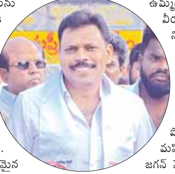
రాబోయేది తెదేపా, జనసేన ప్రభుత్వమే

ప్రజా వ్యతిరేక విధానాలు పాటిస్తూ ప్రజలను ఇబ్బందులకు గురి చేస్తున్నారని, వైకాపా ప్రభుత్వానికి ప్రజలు త్వరలోనే చరమగీతం పాడతారని దర్శి జనసేన నాయకులు గరికపాటి వెంకట్ అన్నారు. జగన్ నిరంకుశత్వ పాలన చేస్తున్నారని, ఇటువంటి పాలన చేసిన వాళ్ళు కాల గర్భంలో కలసి భయం రని దుయ్యబట్టారు. అనారోగ్య నిర్ణయాలతో రాష్ట్రానికి వచ్చిన కంపెనీ లు కూడా పారిపోయేలా చేశారని ఎద్దేవా చేశారు. అన్ని వ్యవస్థలను నాశనం చేసి రాష్ట్ర ఆర్థిక పరిస్థితిని నాశనం చేసారని ద్వేష మెత్తారు. ఉద్యోగులపై కక్ష పెంచుకొని వారు అడుగుతున్న న్యాయమైన పనులను కూడా తీర్చడం లేదని, పక్క రాష్ట్రాల్లో ఇచ్చే పనులలో సగం కూడా మన రాష్ట్రంలో జగన్ ప్రభుత్వం ఇవ్వకపోవడంతో అంగన్వాడీలు, మున్సిపల్ పారిశుధ్య కార్మికులు, ఆందోళనకు దిగారన్నారు. రాబోయేది తెదేపా, జనసేన ప్రభుత్వం అని ఉద్యోగులు న్యాయ మైన డిమాండ్ లు పరిష్కరిస్తామని ఆయన తెలియజేశారు.