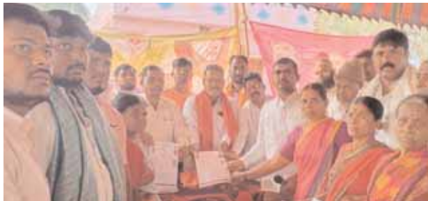
ధరఖాస్తులను స్వీకరిస్తున్న అధికారులు, నాయకులు మర్చిల్లి మేజర్(న్యూస్ జనవరి 03) పేదల అభివృద్ధి కాంగ్రెస్ ప్రభూత్వ లక్ష్యమని అన్నోజిగూడలో అయోధ్య రాముడి అక్షింతల పంపిణీ