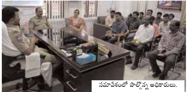
సమావేశంలో పాల్గొన్న అధికారులు.