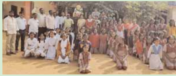
సావిత్రిబాయి పూలే విగ్రహానికి నివాళులర్పిస్తున్న సభ్యులు