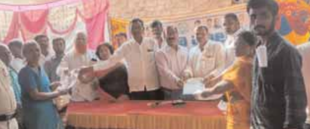
ప్రజా పాలన కార్యక్రమంలో భాగంగా రాంపూర్ గ్రామస్తుల నుండి దరఖాస్తులు స్వీకరిస్తున్న అధికారులు.