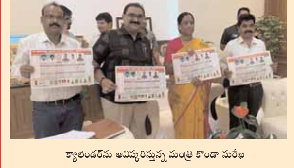
క్యాలెండర్ను ఆవిష్కరిస్తున్న మంత్రి కొండా సురేఖ

మేధల్ జిల్లా ప్రతినిధి మేజర్ న్యూస్ (జనవరి 03) రాష్ట్ర మంత్రులు పొంగులేటి శ్రీనివాసరెడ్డి, కొండా సురేఖ ల చేతుల మీదుగా ఆవిష్కరించిన రాష్ట్ర టి.జి.వో స్ సర్వే అండ్ లాండ్ రికార్డ్స్ యూనియన్ నూతన 2024 క్యాలెండర్ను ఆవిష్కరిస్తున్న మంత్రి పొంగులేటి క్యాలెండర్ను ఆవిష్కరిస్తున్న మంత్రి పొంగులేటి