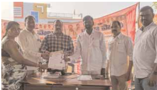
ధరఖాస్తులను స్వీకరిస్తున్న దృశ్యం.