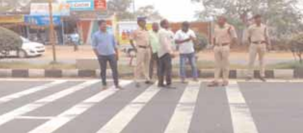
శామిర్ పేట, మేజర్ న్యూస్ (జనవరి 09): రోడ్డు ప్రమాదాల నియంత్రణకు