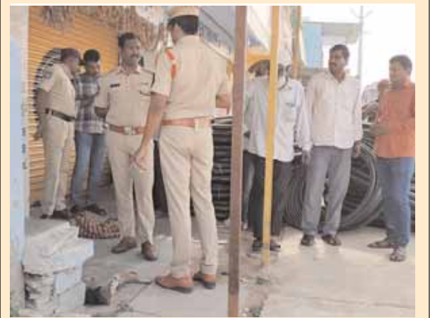
సంఘటన స్థలాన్ని సందర్శించిన పోలీసులు