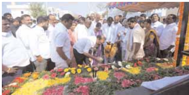
మొదటిపేజీ తరువాయి... పాలమూరు -రంగారెడ్డి ప్రాజెక్టు డిజైన్ మార్చి రంగారెడ్డి, వికారాబాద్ జిల్లాలకు నీళ్లందిస్తామన్నారు. ఐదేళ్లలో పరిశ్రమల ఏర్పాటుకు కృషి చేసి నిరుద్యోగులకు ఉద్యోగ అవకాశాలు కల్పిస్తామన్నారు. పార్టీలకతీతంగా అభివృద్ధికి కృషి చేస్తానని తెలిపారు.