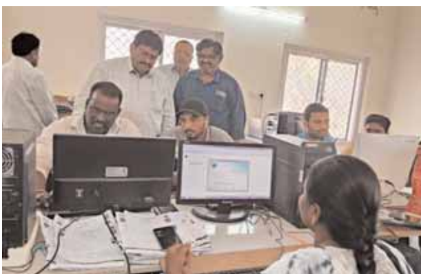
కేశంపేట్ మేజర్ న్యూస్ (జనవరి 12):