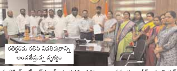
కలెక్టర్ ను కలిసి విసతిపత్రాన్ని అందజేస్తున్న దృశ్యం

గండిపేట్, మేజర్ న్యూస్ (జనవరి 12): బండ్రగూడ జాగీర్ మున్సిపల్ కార్పొరేషన్ లో అవిశ్వాస తీర్మానం రగడ మొదలైంది. కార్పొరేషన్ లో మొత్తం 22 మంది కార్పొరేటర్లు ఉండగా 16 మంది కార్పొరేటర్లు అవిశ్వాసానికి మద్దతు తెలుపుతుండటం అందరినీ ముక్కున వేలేసుకునేలా చేస్తుంది. రాష్ట్రంలోని అన్ని