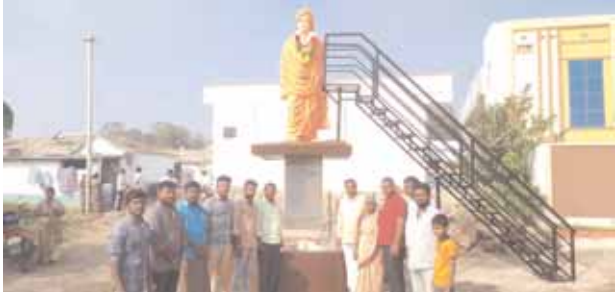
ఇండోల్లో వివేకానంద స్వామి విగ్రహానికి పూలమాలలు వేసిన యువకులు.