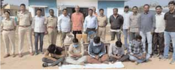
గంజాయిని తరలిస్తున్న యువకులు అరెస్టు, స్వాధీనం చేసుకున్న గంజాయిని చూపుతున్న ఎక్స్ ప్లెజ్ పోలీసులు.