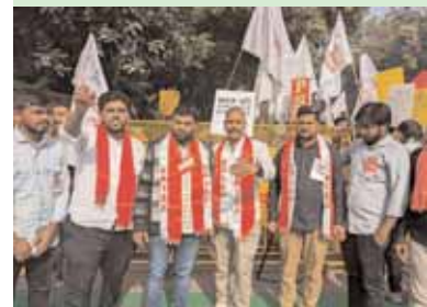
మేడిపల్లి మేజర్ స్కూల్స్: బీజేపీ అనుసరిస్తున్న విద్యా వ్యతిరేక విధానాలను నిరసిస్తూ విఐఎన్ఎఫ్ ఇతర విద్యార్థి సంఘాల ఆధ్వర్యంలో డిల్లీ జంతర్ మంతర్ వద్ద ఛలో షార్ మెంట్ నిర్వహించారు. దేశ వ్యాప్తంగా వివిధ రాష్ట్రాల నుండి తరలి వచ్చిన వేలాది మంది విద్యార్థులు ఈ కార్యక్రమంలో పాల్గొని బీజేపీ అవలంబిస్తున్న విద్యా వ్యతిరేక విధానాలపై నిరసన తెలిపారు. గత పది సంవత్సరాలుగా బీజేపీ ప్రభుత్వం విద్యారంగాన్ని పూర్తిగా నిర్లక్ష్యం చేసిందని ఆరోపించారు. నూతన జాతీయ విద్యా విధానం అమలు చేయడం ద్వారా పేద వర్గాల విద్యార్థులకు విద్యను దూరం చేసే కుట్ర జరుగుతోందని తెలిపారు. విద్యా కాషాయీకరణకు, విద్యా ప్రైవేటీకరణ చేసే మతతత్వ రాజకీయాలను ప్రోత్సహిస్తారని విద్యార్థి సంఘాలు నిరసన చేపట్టారు.