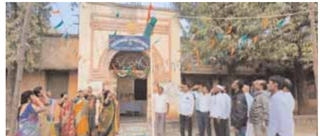
జెండాను ఆవిష్కరిస్తున్న దృశ్యం