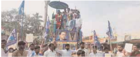
వికారాబాద్ లో అంబేద్కర్ విగ్రహానికి పూలమాల వేస్తున్న డిఎస్పి నాయకులు.