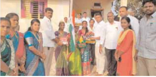
గణతంత్ర దినోత్సవ వేడుకలు పాల్గొన్న గ్రామ పెద్దలు

దోమ, మేజర్ న్యూస్ (జనవరి 26): దేశానికి స్వాతంత్ర్యం వచ్చిన వెంటనే రాజ్యాంగం