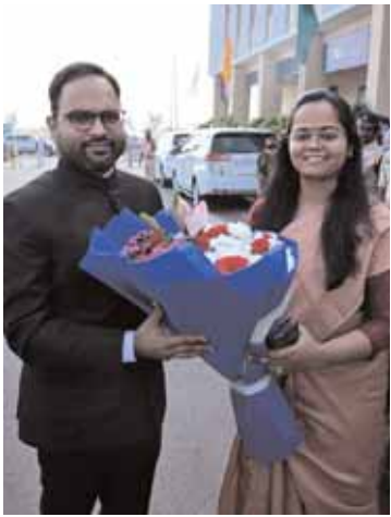
జిల్లా కలెక్టర్ కె.శశాంకకు స్వాగతం పలుకుతున్న అదనపు కలెక్టర్ ప్రతిమా సింగ్.

రంగారెడ్డి జిల్లా సమీకృత రంగారెడ్డి జిల్లా కలెక్టర్ కార్యాలయాల సముదాయంలో 75వ భారత గణతంత్ర దినోత్సవ వేడుకలు శుక్రవారం నాడు ఘనంగా జరిగాయి. ఈ వేడుకల్లో భాగంగా... జిల్లాలో ఉత్తమ సేవలు అందించిన అధికారులకు ప్రశంసా పత్రాలను అందజేస్తున్న కలెక్టర్ శశాంక.