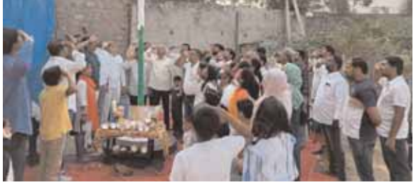
ఇండస్ వ్యాలీలో రిపబ్లిక్ డే వేడుకల దృశ్యం