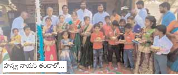
హస్త్య నాయక్ తండాలో...