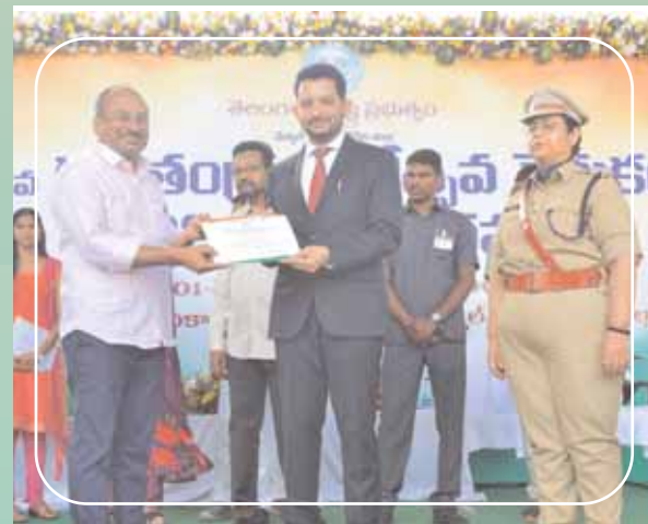
జిల్లా కలెక్టరేట్ ఏవో రామ్మోహన్