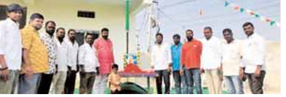
మంచిరేవుల ముదిరాజ్ సంఘం ప్రాంగణంలో గణతంత్ర దినోత్సవ వేడుకలను నిర్వహిస్తున్న దృశ్యం