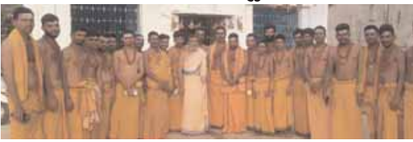
హస్సాబాద్ లో శివ దీక్షలు చేపట్టిన భక్తులు

కొడంగల్, మేజర్ న్యూస్ (జనవరి 26) : మహా శివరాత్రిని పురస్కరించుకొని భక్తులు శివమాల ధారణతో దీక్షలు ప్రారంభించారు. కొడంగల్ మండలంలోని హస్సాబాద్ గ్రామంలో శుక్రవారం 25 మంది భక్తులు శివాలయంలో పూజలు నిర్వహించి మండల దీక్షలు స్వీకరించారు. ఈ సందర్భంగా వారు మాట్లాడుతూ 41 రోజుల పాటు శివదీక్షలు చేపట్టి శివరాత్రి పర్వదినాన శ్రీశైల మల్లికార్జున స్వామి దర్శనంతో దీక్షలు విరమించనున్నట్లు తెలిపారు.