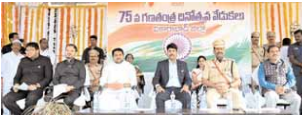
గణతంత్ర దినోత్సవ వేడుకల్లో పాల్గొనడం అధికారులు, నాయకులు.