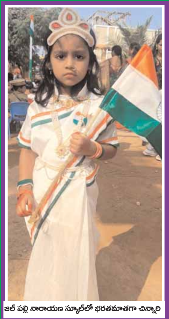
జిల్ పల్లి నారాయణ స్కూల్లో భరతమాతగా చిన్నారు