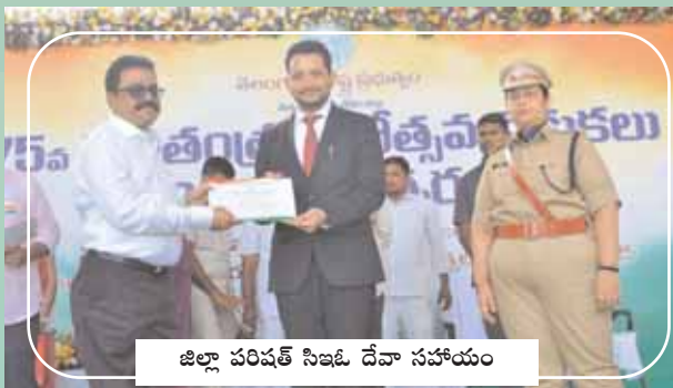
జిల్లా పరిషత్ సిఇఓ దేవా సహాయం