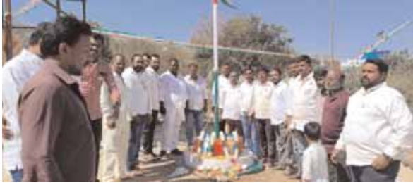
బృందావన్ కాలనీలో గణతంత్ర దినోత్సవం సందర్భంగా జాతీయ జెండాను ఆవిష్కరిస్తున్న కాలనీవాసులు