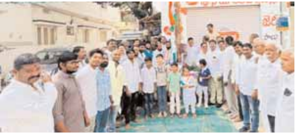
హిమగిరినగర్ కాలనీ రోడ్ నెంబర్ 4 లో జాతీయ జెండావిష్కరణ కార్యక్రమాన్ని నిర్వహిస్తున్న కాలనీవాసులు