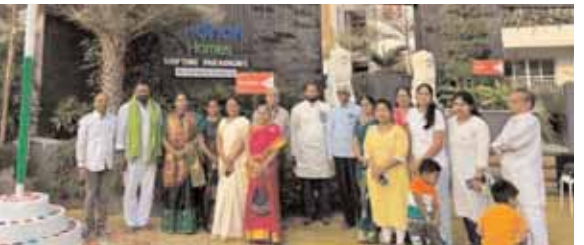
ది ఆర్ట్ గిరిధార్ హోమ్లో 18 వ వార్డు కార్పొరేటర్ జెండావిష్కరిస్తున్న దృశ్యం

గండిపేట్, మేజర్ న్యూస్ (జనవరి 26): గండిపేట్ మండల పరిధిలో గణతంత్ర దినోత్సవ వేడుకలను ఘనంగా నిర్వహించారు. పార్టీ కార్యాలయాలు, ప్రభుత్వ కార్యాలయాలు, ప్రైవేట్ కార్యాలయాలలో జాతీయ జెండాను ఆవిష్కరించే ఒకరికి ఒకరు శుభాకాంక్షలు తెలుపుకున్నారు.