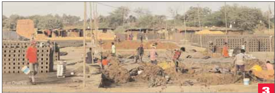
మేడ్చల్, మేజర్ న్యూస్ (జనవరి 27) :

పలక, బలపం పట్టాల్సిన చిట్టి చేతులు బట్టిల్లో మట్టి పిసుకుతూ ఇటుకలను పడుతున్నాయి. ఖార్ఖానాలలో స్నానం పడుతూ బతుకులకు లిపేర్లు చేసుకుంటున్నాయి. స్వాతంత్ర్యం వచ్చి 76 సంవత్సరాలు గడుస్తున్నా బాల కార్మిక వ్యవస్థ పూర్తిగా నిర్మూలించుకోలేక పోవడం మనందరికీ సిగ్గుచేటే. ప్రభుత్వం పలు చట్టాలు తీసుకువచ్చి మార్పు తీసుకువస్తోంది. బాల కార్మిక వ్యవస్థ పూర్తిగా రూపు మాసిపోలేదన్న దానికి నిదర్శనంగా నిలుస్తోంది. అధికార యంత్రాంగం పటిష్ట చర్యలు తీసుకుని పని వయస్సులో చదువుకు దూరమై పనులు చేస్తున్న బాలలను గుర్తించి వారి జీవితాల్లో వెలుగులు తీసుకురావాలని అవసరం ఎంతైనా ఉంది