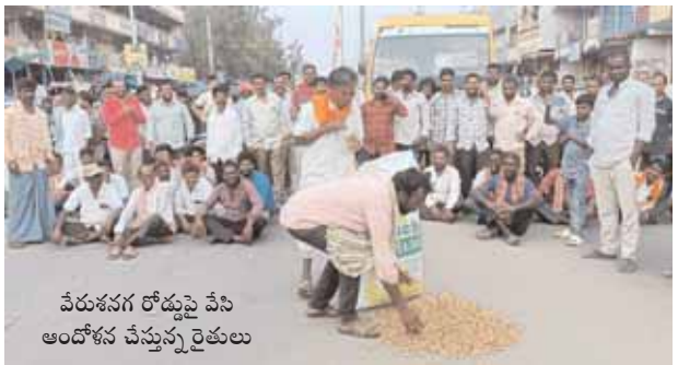
వేరుశనగ రోడ్డుపై పేసి ఆందోళన చేస్తున్న రైతులు

కి పల్లి (వేరుశనగ) అధికంగా రావడంతో ఒక్కసారిగా దళారులు అంత కుమ్మక్కే ధరను రూ. 6500కు తగ్గించారని ఆగ్రహం వ్యక్తం చేశారు. పెట్టిన పెట్టుబడి కూడా రావడం లేదంటూ పల్లికాయ సంచిన రోడ్డుపై తెచ్చి తమ బాధను వ్యక్తం చేస్తున్నారని పేర్కొన్నారు. అత్యుపాత్య తప్ప తమకు వేరే గతి లేదంటూ నిరసన వ్యక్తం చేశారు. పోలీసుల రంగ ప్రవేశం చేయడంతో పరిస్థితి ఉధృతంగా మారింది. రాజకీయ నాయకులు ధర్నా చేస్తే వారికి మద్దతు పలుకుతారని రైతులు తమ పంట కోసం ధర్నా చేస్తుంటే బెదిరింపులకు గురి చేస్తారని ఆవేదన వ్యక్తం చేశారు. తమకు గిట్టుబాటు ధర ఇవ్వకపోతే ధర్నా విరమించు చేసేది లేదని రైతులకు తేల్చి చెప్పారు. డిఎస్సీ రంగప్రవేశం చేసి రైతులతో మాట్లాడారు. దీంతో రైతులు ఆందోళన విరమించారు.