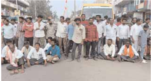
హైవేపై ధర్నా చేస్తున్న రైతులు

పరిగి మేజర్ న్యూస్ (జనవరి 27): రైతులను పండించిన పంటలకు గిట్టుబాటు ధరలు కల్పించాలని డిమాండ్ చేస్తూ శనివారం పరిగిలో రైతులు రోడ్లెక్కి ఆందోళన నిర్వహించారు. వివరాల్లోకి వెళితే శనివారం పరిగి మార్కెట్ కు రైతులు ధాన్యాన్ని అమ్మడానికి తీసుకువెళ్ళగా అక్కడ దళారుల చేత పంటలకు గిట్టుబాటు ధర కలగకుండా దోచుకుంటున్నారంటూ ఆగ్రహం వ్యక్తం చేస్తూ హైదరాబాద్ బీజాపూర్ హైవేపై ధాన్యం తీసుకువచ్చి రోడ్డుపై బయోయింబి ఆందోళన చేపట్టారు. ఈ సందర్భంగా రైతులు మాట్లాడుతూ... రెండు లక్షల రూపాయలు పెట్టుబడి పెట్టి పంటను పండిస్తే దళారులంతా ఏకమై ధరను తగ్గించారని ఆవేదన వ్యక్తం చేశారు. వారం రోజుల కింద వేరుశనగ ధర రూ. 8500 పలికితే పరిగి మార్కెట్లో