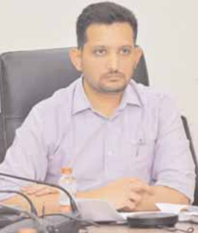
మేడ్చల్ జిల్లా ప్రతినిధి,మేజర్ న్యూస్(జనవరి, 19): మేడ్చల్ మల్కాజిగిరి జిల్లాలో ఈ నెల 20, 21వ

-మేడ్చల్ మల్కాజిగిరి జిల్లా కలెక్టర్ గౌతం - ఈ నెల 20, 21 తేదీలలో ప్రత్యేక ఓటు నమోదు కార్యక్రమం