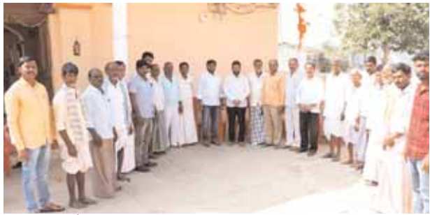
బంట్యూరం, మేజర్ న్యూస్ (జనవరి 19): శుక్రవారం నాడు వికారాబాద్ జిల్లా,