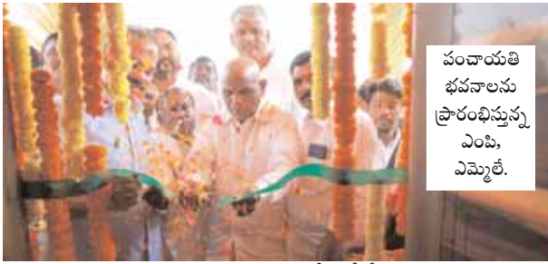
పంచాయతి భవనాలను ప్రారంభిస్తున్న ఎంపి, ఎమ్మెల్యే.