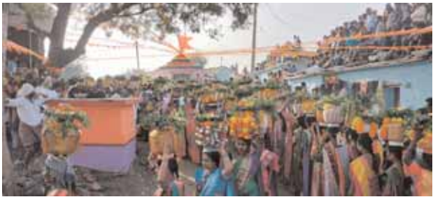
అమ్మవారికి బోనమెత్తిన గ్రామస్తులు

పెద్దెముల్, మేజర్ న్యూస్ (జనవరి 08): అమ్మ మా ఊరు వాడ చల్లగా చూడాలంటూ మహిళలు పెద్ద ఎత్తున బోనాలతో మైనమ్మ దేవతకు నైవేద్యం సమర్పించారు. సోమవారం మండల పరిధిలోని నాగులపల్లి గ్రామంలో గ్రామ దేవత ఊరడమ్మ జాతర ఉత్సవాన్ని పురస్కరించుకొని గ్రామస్తుల ఆధ్వర్యంలో గ్రామంలో కొలువదీరిన మైనమ్మ దేవతకు మహిళలు బోనాలతో ఊరేగింపు నిర్వహించి, మైనమ్మ గుడి చుట్టూ ప్రదర్శనలు చేసి బోనాలతో నైవేద్యం సమర్పించారు. మా ఊరు వాడ, పిల్ల పాపలను చల్లగా చూడాలంటూ ప్రత్యేక పూజలు చేసి మొక్కులు చెల్లించుకున్నారు. గ్రామానికి పాడిపంట బాగుండాలని కోరుకున్నారు. ఈ కార్యక్రమంలో గ్రామ పెద్దలు, మహిళలు, ప్రజా ప్రతినిధులు తదితరులు పాల్గొన్నారు.