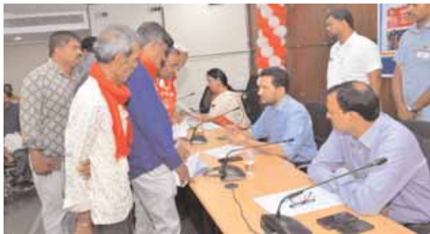
ఫిర్యాదులను స్వీకరిస్తున్న జిల్లా అధికారులు.

మేడ్చల్ జిల్లా ప్రతినిధి, మేజర్ న్యూస్ (జనవరి 08): ప్రజావాణి కార్యక్రమంలో