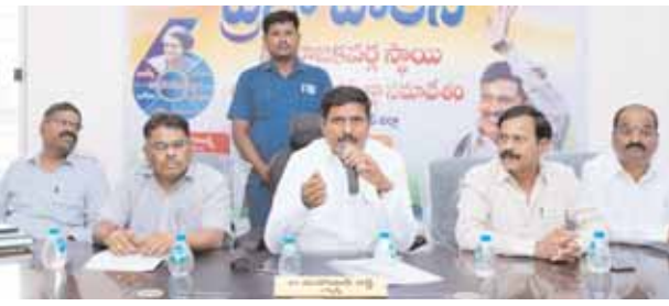
మీడియాతో మాట్లాడుతున్న ఎమ్మెల్యే మనోహర్ రెడ్డి

తాండూరు మేజర్ న్యూస్ (జనవరి 08): తాండూరు ప్రాంతంలో ప్రతి ఒక్కరు స్వేచ్ఛగా ఉంటున్నారని తాండూరు ఎమ్మెల్యే మనోహర్ రెడ్డి పేర్కొన్నారు. తాండూరు పట్టణ సమీపంలోని హైదరాబాద్ రోడ్డు మార్గంలో గల ప్రజా భవన్ లో సోమవారం సాయంత్రం వివిధ శాఖల అధికారులతో సమావేశం జరిపి