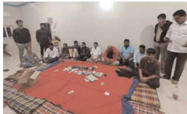
పోలీసులు దాడి చేసిన పేకాట శిబిరం.