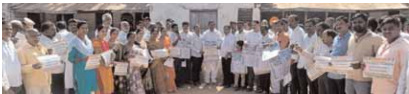
ఎమ్మెల్యే కి విన్నవించారు.