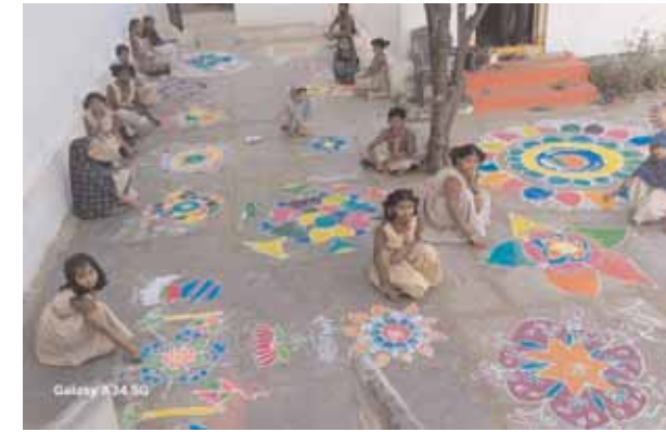
బొంబాయి రెయిన్ బో పాఠశాలలో ముగ్గుల పోటీల్లో పాల్గొన్న విద్యార్థులు