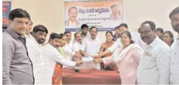
చెక్కులను అందజేస్తున్న ఎమ్మెల్యే రామ్మోహన్ రెడ్డి.

కార్యక్రమంలో పాల్గొన్న ఎమ్మెల్యే రామ్మోహన్ రెడ్డి