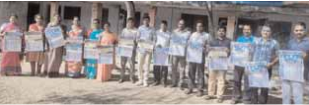
క్యాలండర్ను ఆవిష్కరిస్తున్న దృశ్యం.