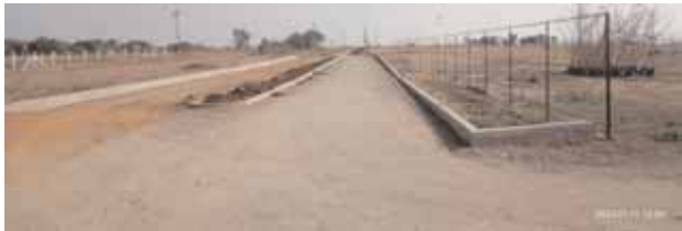
వ్యవసాయ భూమిలో నిర్మించిన వెంచర్లో రోడ్డు నిరాణం వికారాబాద్, మేజర్ న్యూస్ (జనవరి 11): వికారాబాద్ మున్సిపల్లోని గుడుపల్లి, మద్దుల్ చిట్టంపల్లి గ్రామాల రెవెన్యూ పరిధిలో భారీ ఎత్తున వెంచర్ నిర్మాణం

పనులు కొనసాగుతున్నాయి. ఈ వెంచర్ పనులు గత కొంత కాలం నుండి నుండి పనులు కొనసాగిస్తున్నారు. సుమారు 50 ఎకరాలకు పైగా ఉన్న వెంచర్లో నిర్మాణ పనులు జోరుగా జరుగుతున్నాయి. గతంలో ఈ వెంచర్లో హిటాచి, జెసీబీలతో పాటు భారీ వాహనాలతో వెంచర్లో గల ప్రధాన రోడ్డును నిర్మించారు. అదేవిధంగా అందులో విద్యుత్ స్తంభాలు కూడా ఏర్పాటు చేశారు. ఈ వెంచర్ నిర్మాణానికి ఎలాంటి అనుమతులు లేనప్పటికీ దర్జాగా పనులు మాత్రం కొనసాగిస్తున్నారు. కనీసం వ్యవసాయ భూమిని వ్యవసాయేతర భూమిగా బదిలీ చేయకుండానే.. వ్యవసాయ భూమిని చదును చేస్తున్నారు. వికారాబాద్ కు కూతవేటు దూరంలో అక్రమంగా కొనసాగుతున్న వెంచర్ నిర్మాణంపై సంబంధిత మున్సిపల్ అధికారులు స్పందించకపోవడం గమనార్హం. గత కొంత కాలం నుండి ఈ వెంచర్లో పనులు జరుగుతున్నప్పటికీ ఇప్పటి వరకు మున్సిపల్ అధికారులు ఎలాంటి చర్యలు తీసుకోకపోవడంతో వారిపై పలు ఆరోపణలు వెలువెత్తుతున్నాయి. మున్సిపల్ అధికారులకు చేతులు తడిపినందుకే వారు చూసి చూడనట్లు వ్యవహరిస్తున్నట్లు స్థానికులు ఆరోపిస్తున్నారు.