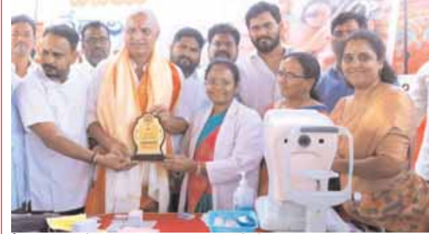
పీర్షాదిగూడ, మేజర్ న్యూస్ (జనవరి 11): శ్రీ శ్రీస్వయాం భు కళాభవన స్వామి ఆలయ ప్రాంగణంలో విజయ నేత్రాలయ ఐ హాస్పిటల్ వారు ఉచితంగా