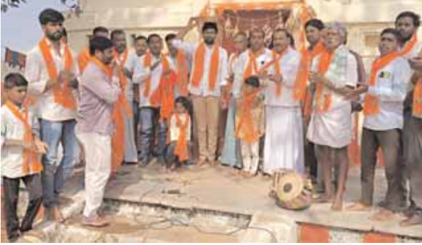
అక్షంతలను వితరణ చేస్తున్న దృశ్యం. దోమ, మేజర్ న్యూస్ (జనవరి 13)ః ఈ నెల 22న ఆయోధ్య రామ మందిరం గుడి