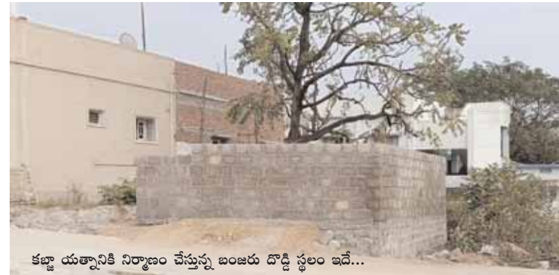
కట్టా యత్నానికి నిర్మాణం చేస్తున్న బంజరు దొడ్డి స్థలం ఇదే...