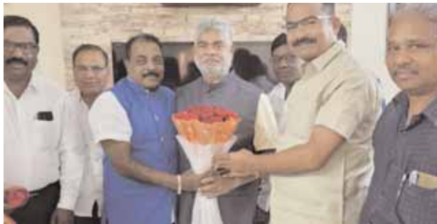
స్పీకర్ గడ్డం ప్రసాద్ కు పుష్పగుచ్ఛం అందజేసి ఘోషాక్షయాల తెలుపుతున్న లియాఫీ నాయకులు వికారాబాద్ మేజర్ న్యూస్ (జనవరి 13): లియాఫీ అలిండియా సలహాదారు