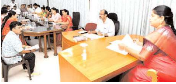
ఆమోదించడమైనదన్నారు. స్వస్థ సర్వేక్షన్ 2023 లో జాతీయస్థాయిలో