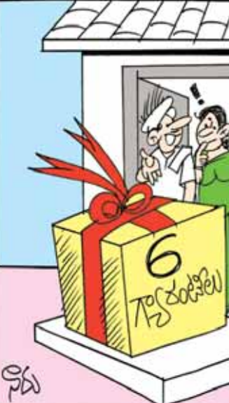
ఈ ఆరు గ్యారంటీలే హామీ న్యూయర్ గిఫ్ట్ అంటు