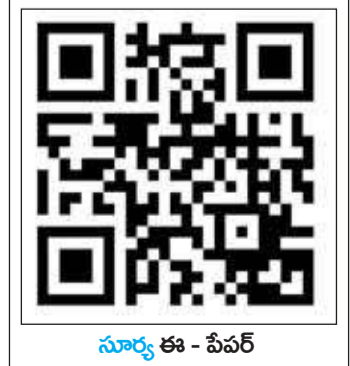
సూర్య ఈ - పేపర్