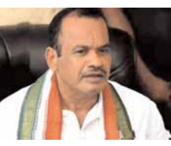
ప్రత్యేక చొరవతో రాష్ట్రంలో రోడ్లు భవనాల శాఖలో తొలి మంత్రిగా సర్కార్ జిల్లాకే దక్కింది. దీంతో జిల్లాలోని రోడ్ల రూపరేఖలు మారిపోయాయి. మంత్రిగా పదవి ప్రమాణ స్వీకారం చేసిన తర్వాత తొలి

సంతకం చేసిన 100 కోట్ల విలువైన ఈ నాలుగు రహదారుల విస్తరణ ప్రతిపాదనలకు బుధవారం ప్రభుత్వం పరిపాలన అనుమతులిస్తూ జి.ఓ.ఆర్డీ నెం-22 ను విడుదల చేసింది. మంత్రి కోమటిరెడ్డి వెంకట రెడ్డి స్వయంగా ముఖ్యమంత్రి రేవంత్ రెడ్డి, ఉప ముఖ్యమంత్రి భట్టి విక్రమ్ రెడ్డి తో సంప్రదింపులు జరిపి ఈ పనులను వేగంగా ముంజూరి చేయించారు. ఈ సందర్భంగా మంత్రి కోమటిరెడ్డి వెంకట రెడ్డి మాట్లాడుతూ ఈ నాలుగు ప్రతిపాదన రహదారులపై రోడ్లండ్ల జిల్లా ప్రజలు నిత్యం సరకం చూసినప్పటికీ గత ప్రభుత్వం ఏ మాత్రం పట్టించకోలేదన్నారు. జిల్లా ప్రజలు, పట్టికలు, టీవీ ఛానెళ్లు ఈ రోడ్ల దుస్థితి గురించి కొన్ని వందలసార్లు తెలియజేసి ప్రయత్నం చేసినా కనీస స్పందన కరువయ్యింది. ఎందరో యువకులు ఈ రహదారులపై ప్రమాదాల్లో చనిపోతుంటే నా మనసు చలిచిపోయిందని ఇదే విషయం ముఖ్యమంత్రి, ఉప ముఖ్యమంత్రి కి వివరించి కాంగ్రెస్ పార్టీని ఆదరించిన సర్కార్లండ్ల జిల్లా ప్రజల రుణం తీర్చుకుందామనే సందేశంతో ఈ నాలుగు రోడ్లను నెల రోజుల్లో మంజూరి చేయించినాను అని తెలిపారు. ఈ రోడ్లను వూర్తి నాణ్యత ప్రమాణాలు పోలింది. వచ్చే ఆరు నెలల్లో వూర్తి చేసి జిల్లా ప్రజలకు అందుబాటులోకి తెచ్చేలా చర్యలు తీసుకుంటామని.. తానే స్వయంగా నిర్మాణ పనులను పర్యవేక్షిస్తానని ఆయన తెలిపారు. అంతేకాదు.. రాబోయే రోజుల్లో తెలంగాణలోని ప్రతి రోడ్డును అభివృద్ధి చేసి ప్రమాదరహిత తెలంగాణ నిర్మిస్తామని ఆయన తెలిపారు.