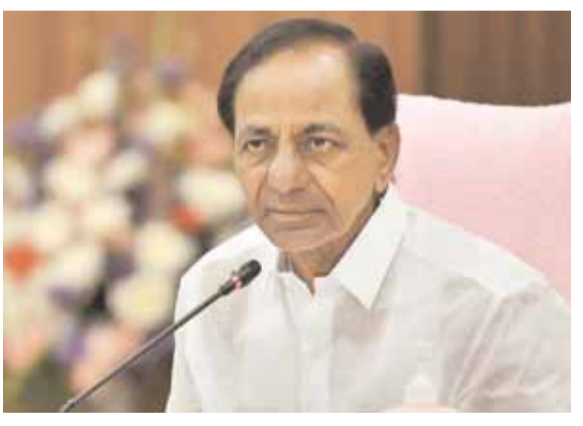
కారణాలపై బీఆర్ఎస్ నాయకత్వం సమీక్షలు నిర్వహించనుంది. ఆయా అసెంబ్లీ నియోజకవర్గాల్లో ఓటమికి గల కారణాలపై ఆ పార్టీ నాయకత్వం

● అసెంబ్లీ వారిగా సమీక్షించనున్న కేసీఆర్ ● ఆరోగ్యం కుదుట పడేసే తర్వాత పార్టీ కార్యక్రమాలపై ఫోకస్ పోకన్ పెట్టింది. ఏ కారణాలు ఓటమికి దారితీశాయో విషయంపై పార్టీ నాయకత్వం సమీక్షలు నిర్వహించనుంది. హిందూ రిస్క్స్ మెంబర్ సర్గర్ తర్వాత కేసీఆర్ తన నివాసంలో విశ్రాంతి తీసుకుంటున్నారు. కేసీఆర్ ఆరోగ్యం మెరుగు పడుతుంది. ఫిబ్రవరి మాసంలో పార్టీ కార్యక్రమాల్లో కేసీఆర్ పాల్గొంటారని నేతలు చెబుతున్నారు. పార్లమెంట్ నియోజకవర్గాల సమీక్ష సమావేశాలు వూర్తి కాగానే అసెంబ్లీ నియోజకవర్గాల వారీగా సమీక్షలు నిర్వహించాని బీఆర్ఎస్ నాయకత్వం భావిస్తుంది. ఈ సమీక్షలు వూర్తి తర్వాత కేసీఆర్ జిల్లాల్లో పర్యటనలు చేయనున్నారు. పార్లమెంట్ ఎన్నికలకు పార్టీ క్యాండ్ ను సన్నద్ధం చేయడానికి జిల్లాల్లో కేసీఆర్ పర్యటించనున్నారు.